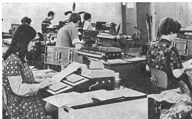
Un faccia a faccia impressionante: l'uomo e la macchina.

Tuttavia, tutto non è mai totalmente perduto. C'è sempre un tempo in cui agire e reagire. I cosiddetti mali della civilizzazione e la loro dolorosa evoluzione sono ben noti, perchè descritti in tutti i loro aspetti. Si presume persino quelle che saranno le loro conseguenze. Se si teme o ci si attarda tanto ad attaccare le loro cause, dipende forse dall' impegno di tutti e di ciascuno di noi . La massa , proiettata brutalmente nell'universo non ancor strutturato del tempo libero, anzichè trovarvi un'insperata sorgente di benessere e di vitalità, o vi si è assopita — affondando nell'ignavia o nell'ozio, funeste fasi conclusive delle frenesie della vita quotidiana —, o, all'opposto, «ignorando il vero riposo, così come la vera fatica, — scrive giustamente Fourastié — giunge a trasportare nel tempo libero i ritmi e il nervosismo del lavoro; essa massa porta con sè l'intossicazione della vita trepidante e ritmi, dai quali non sa più liberarsi. Il fatto può essere osservato in maniera molto palese nel Giappone, dove il gioco popolare «Patchenko», al quale si danno giornalmente milioni di uomini, non fa che riprodurre i gesti a scosse, a strappi d'un lavoro industriale accelerato!...».