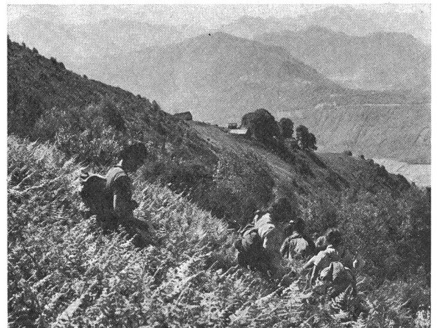
Scoprire il mezzo d'utilizzare il tempo libero per essere più felici!

Due piccole frasi riassumono l'evoluzione della nozione di tempo libero dalle origini dell'umanità ad oggi. La prima è quella che possiamo leggere nel libro della Genesi, che dice: «Dio benedisse il settimo giorno, perchè s'era messo a riposare dopo il gran lavoro della creazione»; la seconda è quella che esce dalla penna di Jean Fourastié: «Oggi, il tempo libero si scatena sull'uomo come una valanga di primavera!».