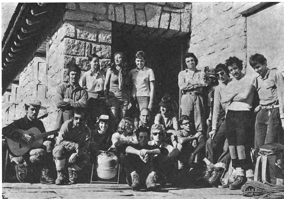
Un gruppo di partecipanti al corso CAS Ticino alla Capanna dell'Albigna

palestre ideali per l'alpinismo G + S ticinese