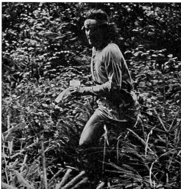
Correre sul terreno impervio, nella boscaglia, nel sottobosco, esige una pronunciata destrezza motoria che dev'essere ben sviluppata per diventare buoni orientisti.