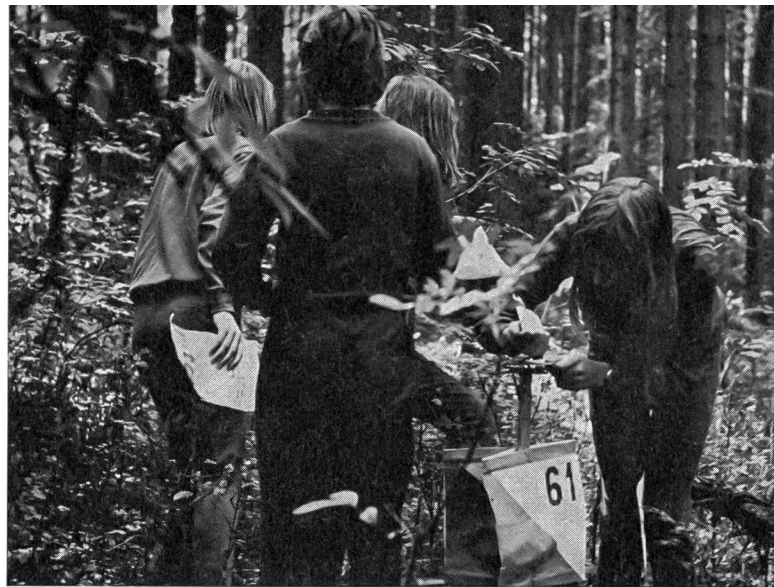
I concorrenti alle prime armi hanno faticato parecchio a trovare il posto 61. Dopo infruttuose ricerche, una componente della squadra annuncia un raggiante «è qui».