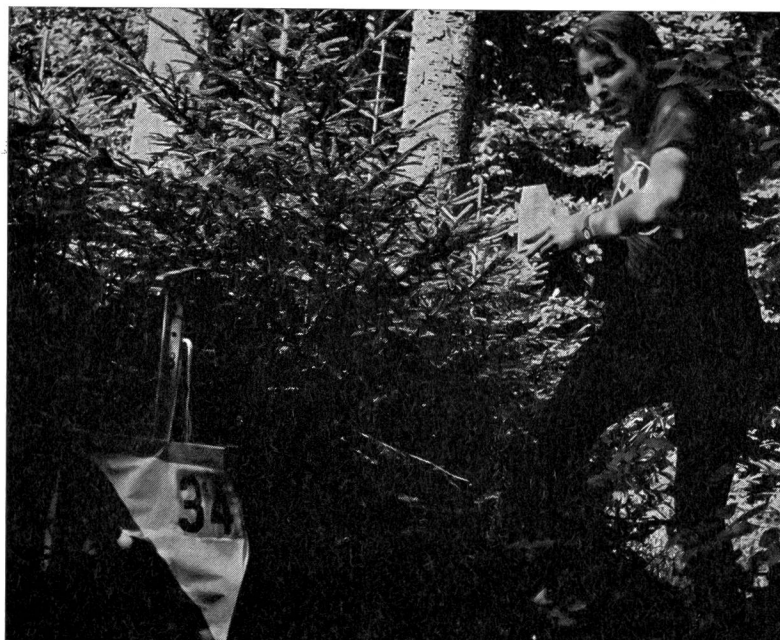
Con sicurezza questa partecipante entra nella zona del posto, un ultimo sguardo alla carta e alla descrizione del posto e già si trova davanti alla lanterna, la carta di controllo vien forata e già è scomparsa...