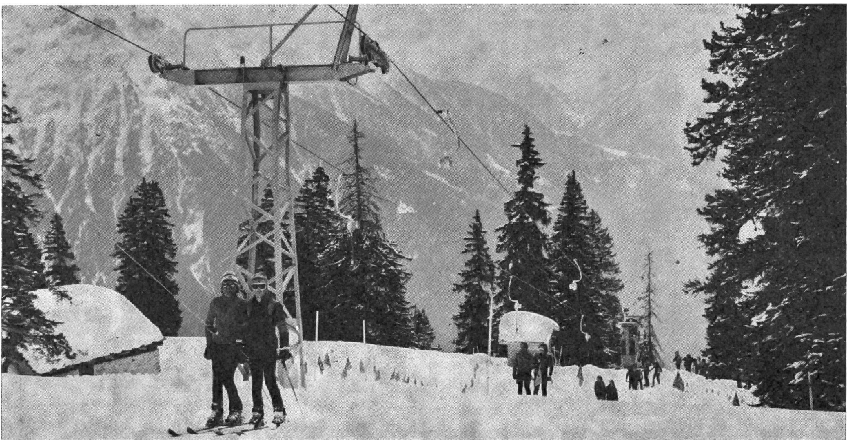
I partecipanti al corso hanno potuto beneficiare delle modernissime attrezzature di risalita che portano alla Bassa di Nara.