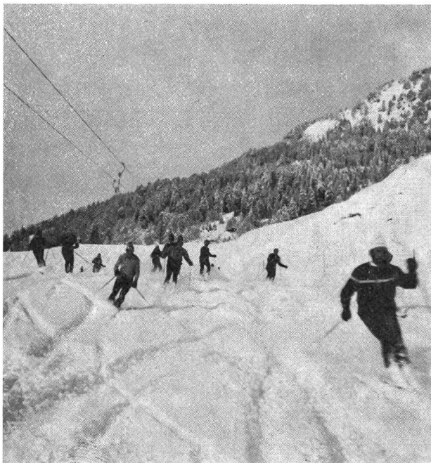
Futuri monitori G+S al lavoro pratico

Blenio e alla dir. della FLOC di Locarno-Cardada per la comprensione e lo spirito di collaborazione dimostrati, mettendo a disposizione, esclusivamente dei corsi G+S, gli impianti di risalita, dando in tal modo un contributo tangibile e concreto agli organizzatori. Secondariamente non possiamo esimerci dall'estendere un vivo plauso agli istruttori, già citati sopra, grazie ai quali è stato possibile offrire ai partecipanti un insegnamento qualitativo e tecnicamente pregevole. Inoltre degli istruttori va messo in giusto rilievo il loro senso di dedizione che li ha portati parecchie volte a restare operanti fino a tarda sera. Queste prestazioni spontanee e disinteressate dovrebbero essere maggiormente comprese e valutate anche dai nostri superiori!