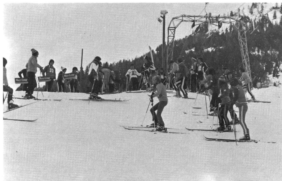
Lo sci, lo sport preferito in G+S.

La maggior entrata è derivata dalla più accentuata attività svolta dalle Associazioni e dai Gruppi che ha, per riflesso, influito positivamente sulla percentuale spettante al Cantone. Inoltre l'aumento sensibile dei sussidi per i corsi monitori è dovuto al fatto che nel 1976 furono organizzati parecchi corsi di aggiornamento, annullati nel 1975 in conseguenza delle misure di risparmio imposte dalla Confederazione. Dal 1° gennaio 1975 ogni monitore qualificato è tenuto ad effettuare un corso di aggiornamento ogni 3 anni, anziché ogni 2 anni.