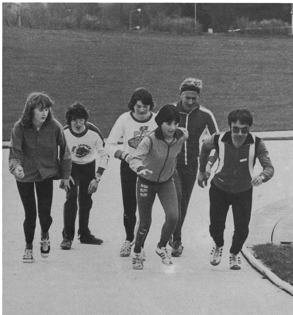
Tabella 4 (n = 320)

Cause d'impedimento alla pratica sportiva