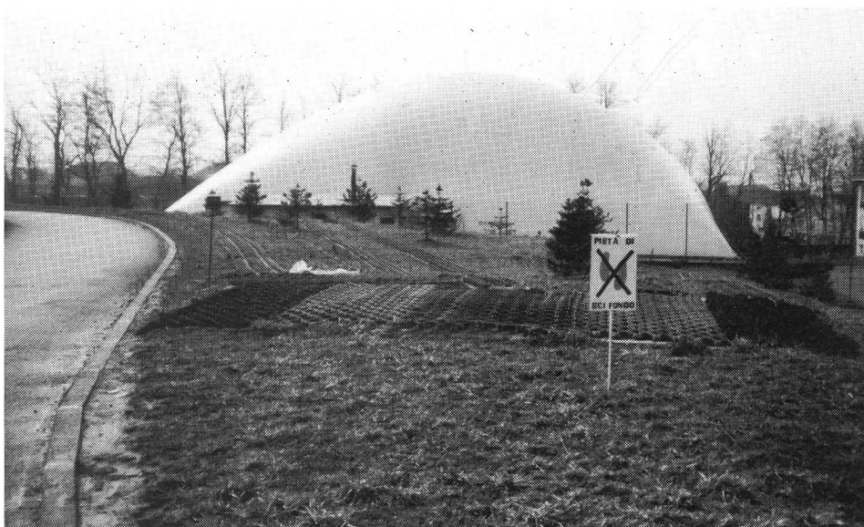
La pedana di partenza/arrivo della pista sintetica di sci di fondo.