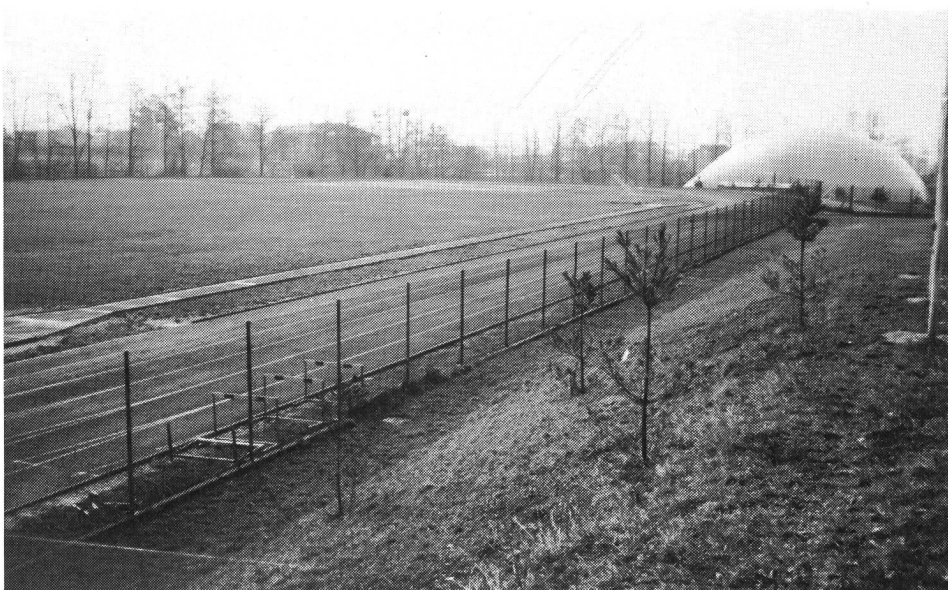
La pista d'atletica e sul fondo i campi di tennis coperti durante la stagione invernale.

Si stanno nel frattempo concludendo i lavori di rifinitura della piscina coperta: un