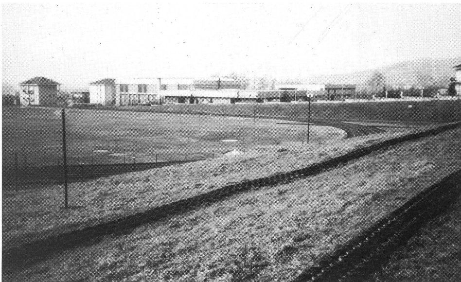
In primo piano: la doppia traccia sintetica per lo sci di fondo.