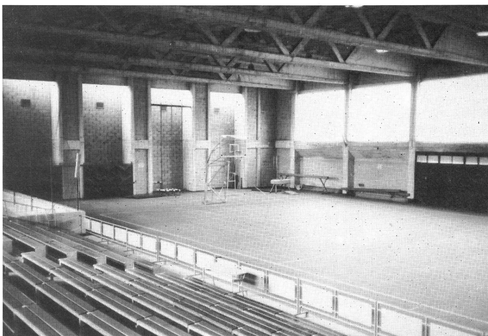
L'interno della grande palestra di Mombarone.