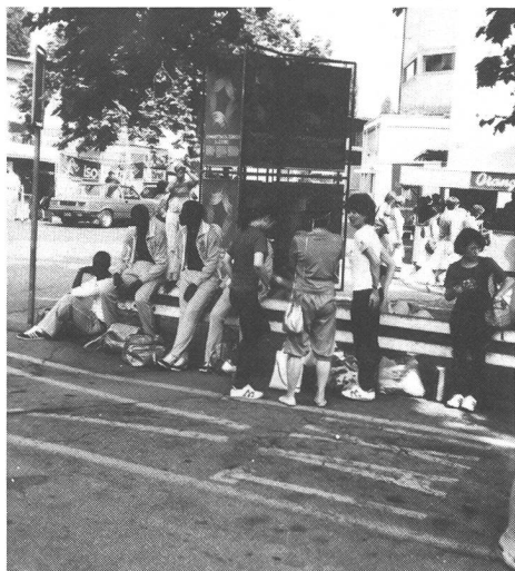
Gialli e neri all'ombra, eppure il sole li accomuna.

Della festa mondiale della ginnastica ha già detto con competenza Clemente Gilardi nell'articolo che precede. Chi ha visto la Gymnaestrada 1982 sa che si tratta di qualcosa che non si può riproporre, nemmeno con la televisione a colori. C'è un'autentica festa nella festa, con tutto un corollario di sensazioni, d'esperienze, d'impressioni. Salta fuori tutto quanto sa di decubertiniano: quel che conta è partecipare – lo sport affratella i popoli, ecc. Questo per quanto concerne il lato sportivo. Poi c'è quello umano, quello frivolo, quello stile kermesse , quello da baraonda e anche quello genuino di festa popolare. In 20 000 gli interpreti, in oltre 100 000 gli spettatori. Tutto esaurito a ogni esibizione. Calore umano sopraffatto dall'afa. 85 interventi dei samaritani nella sola serata inaugurale per svenimenti e collassi. Termometro tropicale: a tuta e tutina si preferisce il Tanga, agli energetici la birra