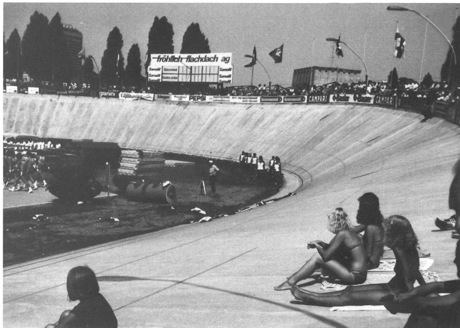
Velodromo di Oerlikon: la spiaggia della Gymnaestrada '82.