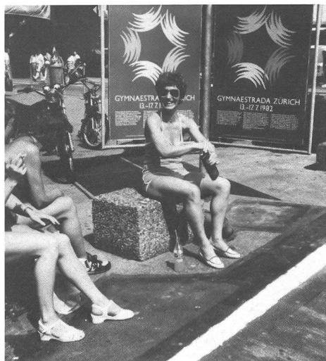
Mi sa che quest'anno m'abbronzio come si deve, dice la nordica.