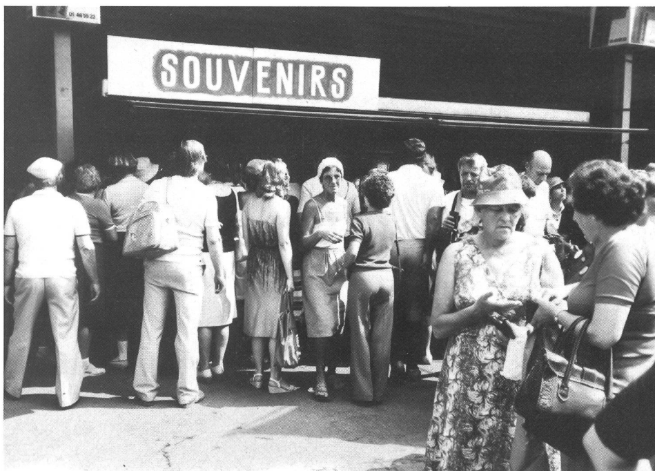
Sempre una tale ressa al bancone dei souvenirs.

e il gelato; l'anello di cemento del velodromo di Oerlikon si trasforma in spiaggia (sole, sole, sole – gridano le nordiche – abbronzami!).