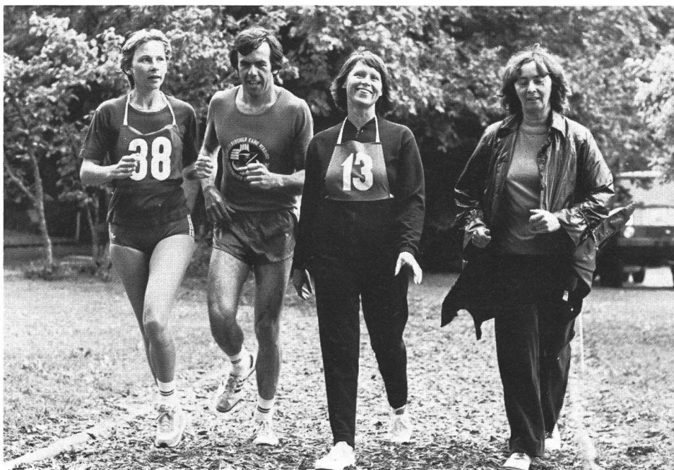
La pista finlandese: un impianto sportivo «per tutti».

Gli impianti sportivi che costituiscono un elemento essenziale dell'infrastruttura devono essere integrati nella sistemazione del territorio. Altrimenti gli interessi degli sportivi rischiano di non essere considerati del tutto o di esserlo solo parzialmente in ragione delle strutture spaziali prestabilite. Le attese legate alla sistemazione del territorio tendono innanzitutto alla realizzazione di un obiettivo socio-politico: la messa a punto di impianti sportivi adeguati per la frazione di popolazione effettivamente e potenzialmente sportiva. A questo riguardo, una sistemazione ottimale presuppone una pianificazione razionale e a lunga scadenza, ma fondata su dati quantitativi degni di fede. Comunque, per trovare una soluzione soddisfacente a questa complessa problematica di necessità e alla pianificazione di impianti sportivi, bisognerebbe prevedere globalmente tutti gli aspetti eco-