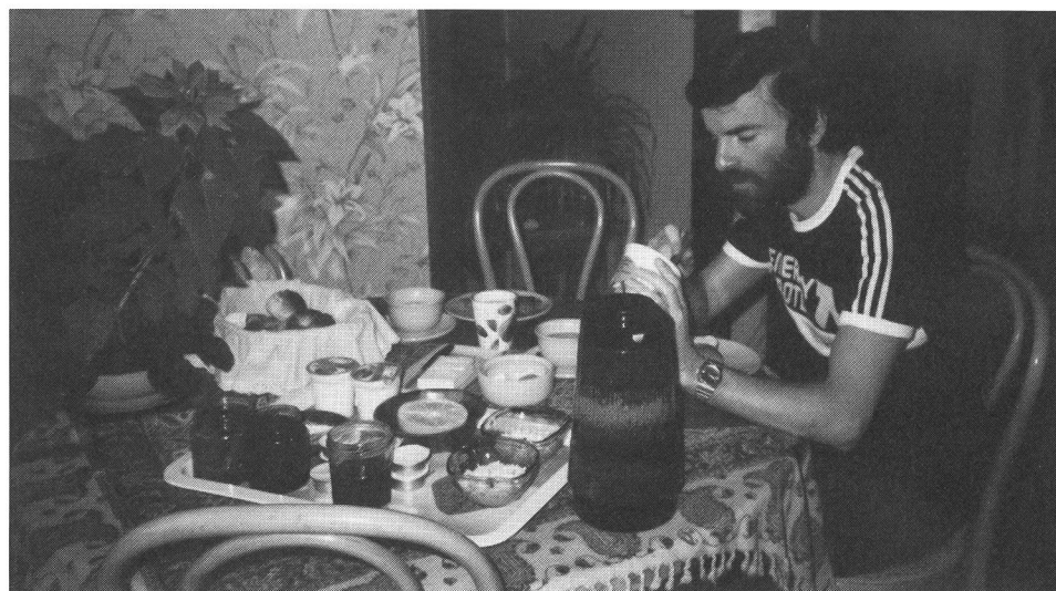
La prima colazione deve coprire circa un terzo del fabbisogno giornaliero. Essa dovrebbe comprendere una spremuta di agrumi, fibre grezze quali quelle contenute nei fiocchi di frumento integrale e di avena, pane con miele, tè o caffè dolcificati con fruttosio, eventualmente un uovo bollito.