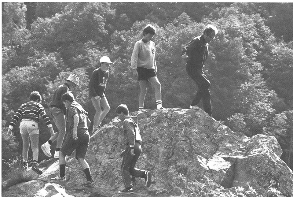
Il monitore mostra la via da seguire.

reagiscono a ciò che è richiesto loro: piace e, allora, s'impegnano a fondo, non piace «fanno il muso»; se troppo duro lo diranno, se troppo facile perdono l'interesse