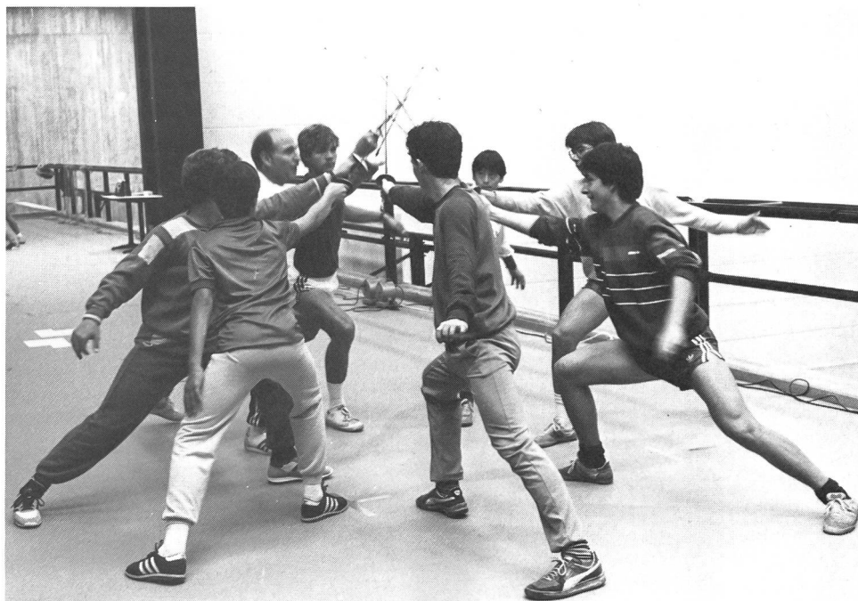
Il monitore è uno sportivo attivo.

I giovani si sottomettono alla decisione del monitore, poiché sanno,