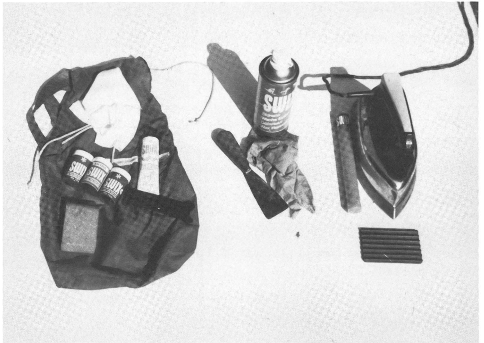
Semplice equipaggiamento per G + S e dilettanti. Per la pulizia: Spatola, detergente e straccio. Preparazione zona di scorrimento: sciolina, ferro da stiro, spatola di plastica. Sciolineatura: 3 scioline dure, 1 Klister universale, 1 sughero, 1 spatola di plastica uno straccio (non in tessuto fibroso). Sull'immagine manca il termometro.