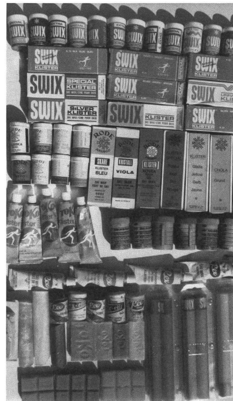
Una scelta confusa per l'«alchimista» della sciolinatura.

La ricerca della miglior sciolina possibile, ha indotto alcuni fabbricanti a uno sviluppo sbagliato: sempre più scioline speciali sono apparse sul mercato, da utilizzare in spazi di temperature sempre più ristretti: ciò che ha disorientato i fondisti, anche per il fatto che i risultati non sono migliorati.