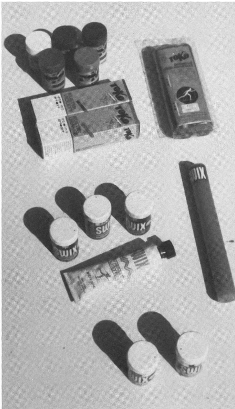
Dall'assortimento per le gare a quello più semplice per il turista. Dall'alto: Toko Compact con 5 scioline dure e 2 Klister, una sciolina Universale o sistema Skating; blu, verde, rosso e un Klister universale, inoltre sciolina di scorrimento d'applicare con il ferro o lasciare (Swix); assortimento d'escursione con una sciolina per neve secca e una per quella bagnata.

Uno sci duro è sempre «appuntito», uno morbido piuttosto «ottuso» (in tedesco si dicono «spitz» e «stumpf», speriamo con la traduzione proposta d'averne dato il senso).