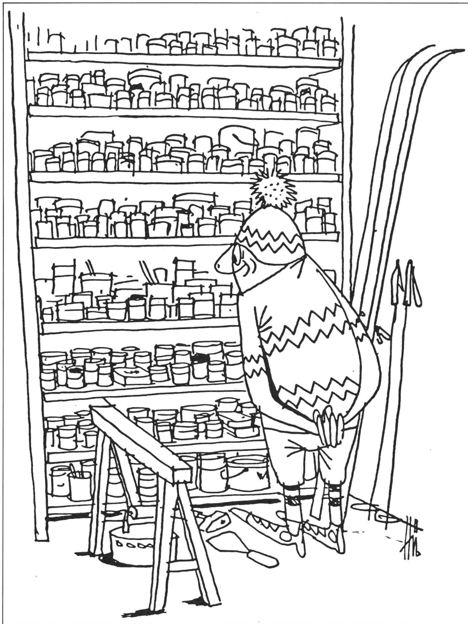
da «Sci-fondisti ridono più a lungo» (Schneider e Hürlimann, Bergverlag).

Chi, nel corso della stagione invernale, ha già provato tutte 12 le scioline dure e i 10 Klister (di una sola marca)? Chi può dire di conoscere le caratteristiche d'applicazione di tutti i tubetti e barattoli della sua cassetta di sciolinatura? Perché si trovano in questa cassetta? Per far colpo sugli avversari, per giocare all'alchimista oppure per essere armati per qualsiasi caso speciale? Con senno di poi si potrà sempre affermare d'aver sbagliato sciolina: «Ah, se invece di due strati rosso-blu ne avessi messi tre di blu-rosso ...».