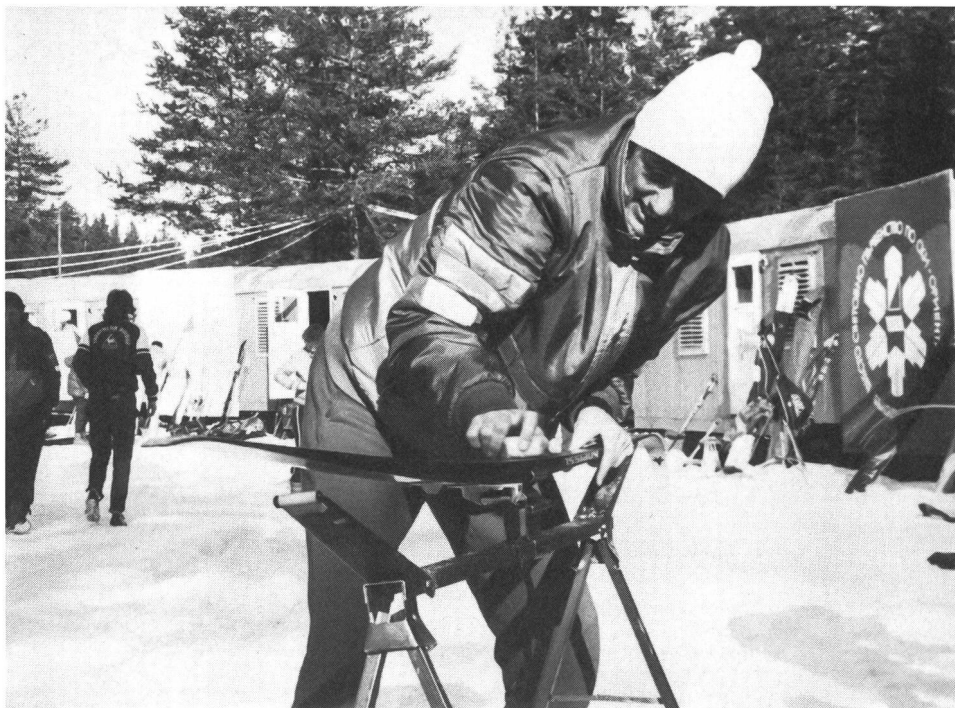
Anche gli sci No-Wax necessitano di cure: detergente e straccio, Spray per squame e scioline per le zone strutturate.

E i principianti, come possono raccogliere esperienze? Semplice, sciolinando loro stessi!