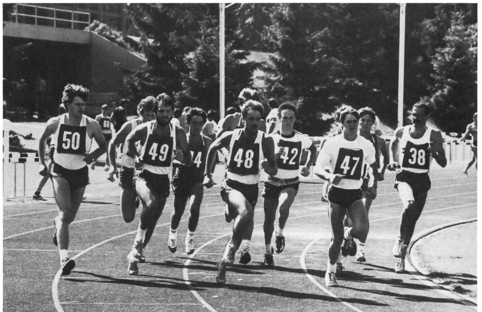
Un'istantanea degli esami d'ammissione del 1985.

Gli sportivi di élite (in possesso di un certificato CNSE) interessati si devono inoltre informare presso le rispettive federazioni.