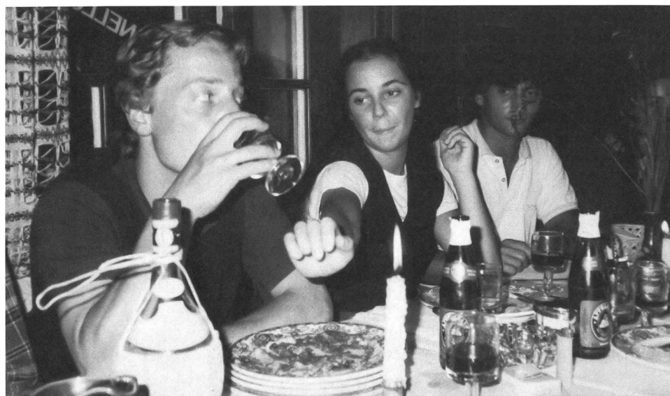
L'oscuro cibo del desiderio ...