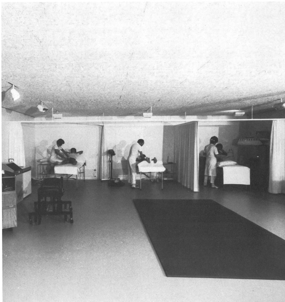
Il nuovo e spazioso settore di fisioterapia dell'Istituto di ricerche di Macolin.

Sarà solo in un secondo tempo che si passerà al recupero dell'ampiezza articolare e poi della forza muscolare, utilizzando le varie metodiche kinesiterapiche, l'innervazione reciproca, le reazioni posturali fino alle tecniche di facilitazione neuromuscolare (si pensi per esempio alla importanza e alle possibi-