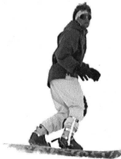
Preparare la prossima curva