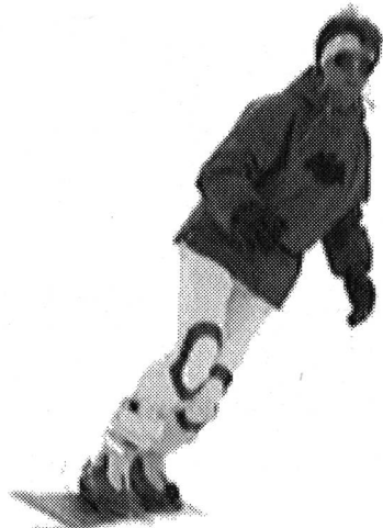
Peso sull'interno durante la curva