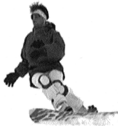
Condotta con flessione, preparare il prossimo scatto