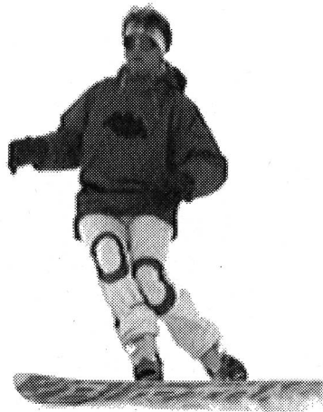
Estensione dinamica, preparare la rotazione con il tronco