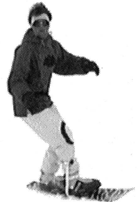
Peso sull'interno, rotazione