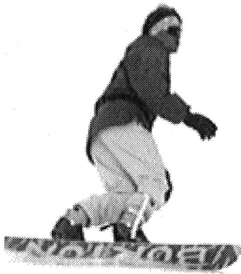
Preparazione del movimento bassa