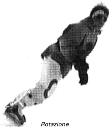
Rotazione verso l'interno