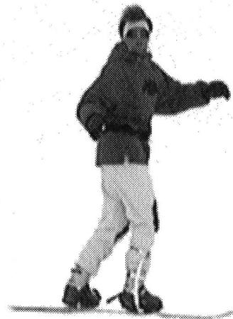
Preparare la rotazione con il tronco, spigolare direttamente