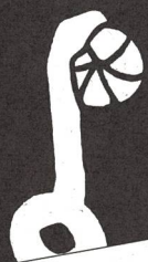
foto e testo di Hugo Lörtscher traduzione ed adattamento di Rossella Cotti