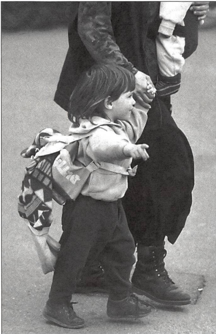
Il bambino alla scoperta di ...

l'espressione del viso ( la differenza tra pensieri interiori e azioni esteriori è molto evidente). I movimenti delle mani ci forniscono indicazioni importanti, perché non provare ad osservare anche il corpo dei vostri interlocutori alla prossima riunione?