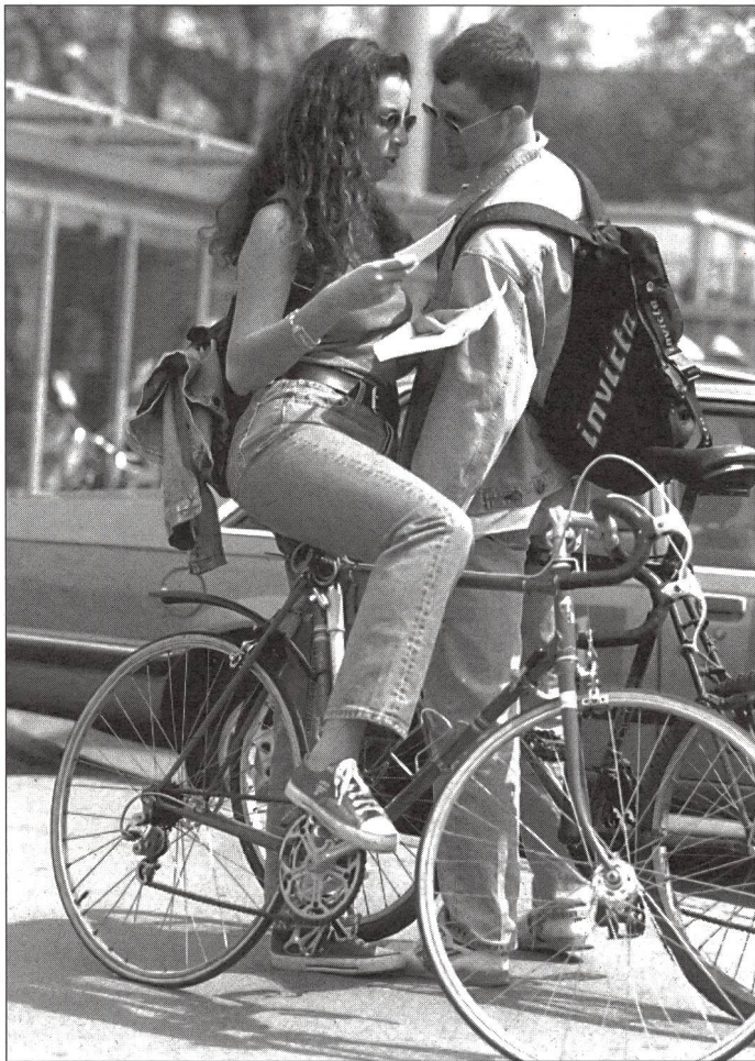
L'amore: importante veicolo di comunicazione corporea.

esprime tutt'altra cosa. Questo diminuisce la nostra percezione di questi messaggi non verbali che i nostri interlocutori ci comunicano con i loro segnali, atteggiamenti, gesti e azioni.