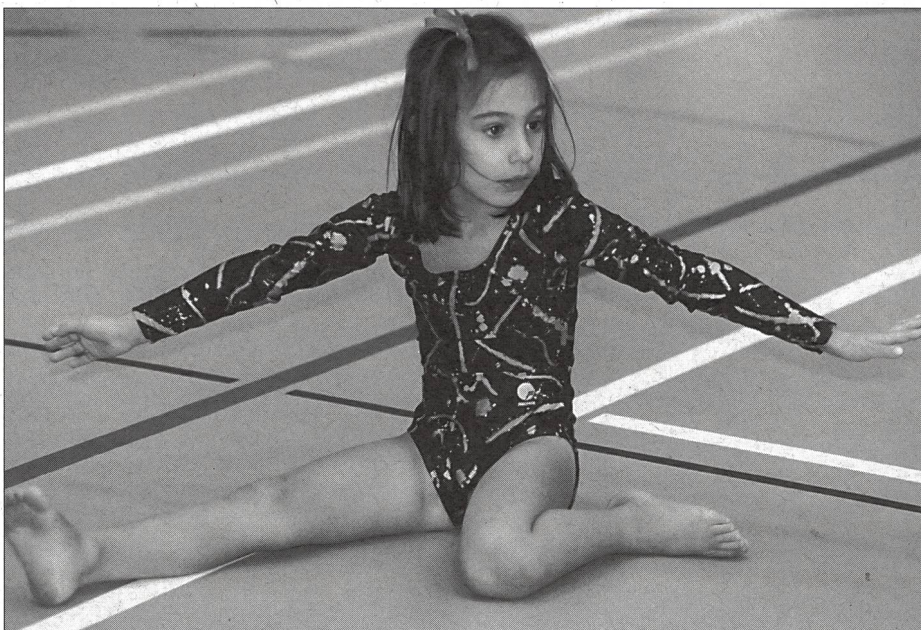
Non considerare il bambino un piccolo adulto.

Lo sport d'alto livello si compone di un certo numero di sotto-culture, caratterizzate da norme, atteggiamenti e abitudini comportamentali che possono variare dalle regole prestabilite. Alcune di queste sotto-culture possono suscitare atteggiamenti positivi e altre comportamenti biasimevoli, come la violazione di certe regole o l'aggressività. La coesistenza di due tipi di regole genera l'apparizione di una morale a doppia faccia. Non è raccomandabile trasferire sotto-culture di sport professionistico nel quadro dello sport dei bambini. ■