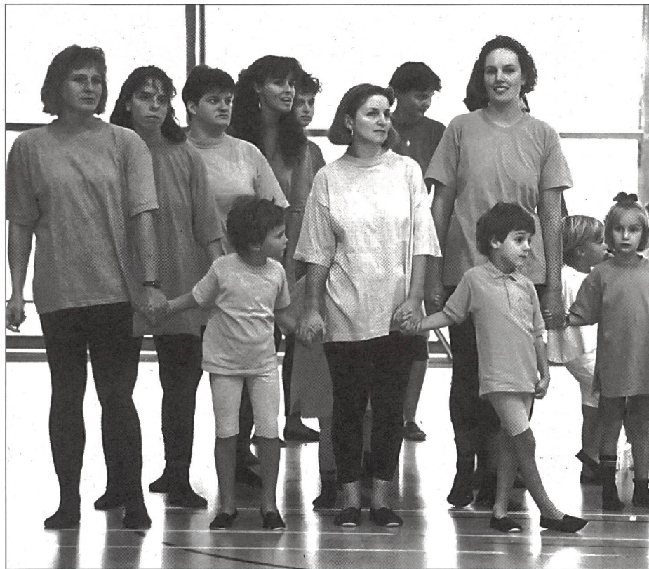
Coinvolgere gli adulti in favore dello sport infantile.