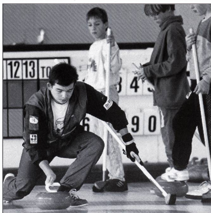
In copertina: Concentrarsi, mirare ed accompagnare la pietra con precisione. Ecco una tra le innumerevoli possibilità di fornire una prestazione nello sport. A questo tema sono dedicati alcuni articoli di questo numero.