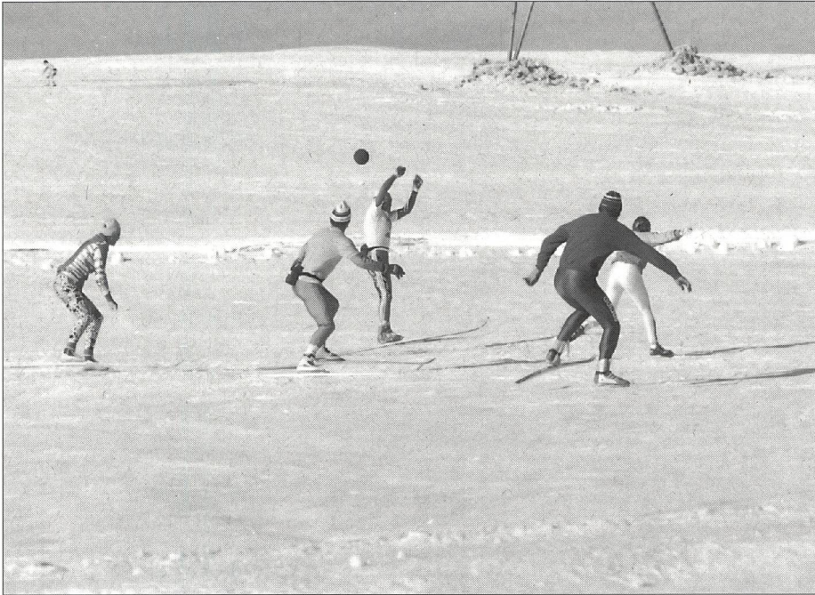
Lo sci di fondo, ora, piace anche ai giovani.