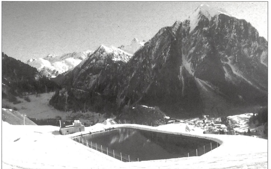
Un bacino artificiale per lo sci e l'agricoltura.

erano pochi e praticamente legati ad una stazione sciistica precisa. Anche G+S è cresciuto enormemente negli ultimi anni e la creazione del centro alla Torretta ha portato ad una nuova concezione della formazione: tutti i corsi hanno come campo base Bellinzona e giornalmente si effettuano degli spostamenti in direzione delle località invernali, se possibile del Ticino, altrimenti fuori Cantone. La nuova concezione, oltre a collaborare con tutte le stazioni in egual modo senza privilegiarne nessuna, evita tutti i problemi di pianificazione, effimera per la mancanza di neve, in uno o nell'altro posto. Inoltre questa