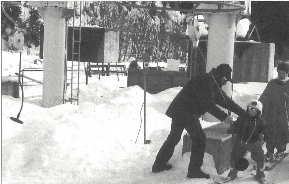
D'estate nei campi, d'inverno agli impianti di risalita.

per accogliere in modo ottimale i portatori di handicap. A partire dal prossimo anno avremo dunque a disposizione circa 200 posti letto.