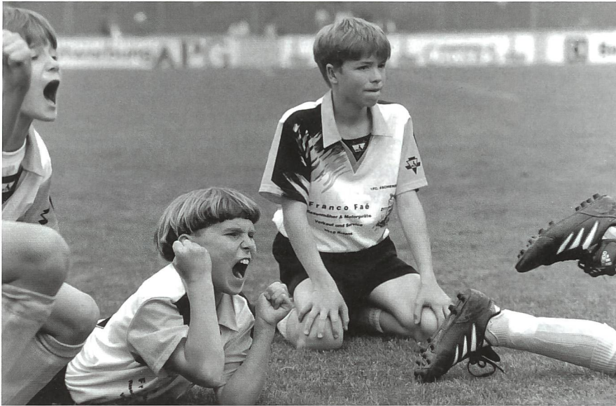
Si parla sempre più apertamente degli abusi sessuali nello sport.

denunciante, ma intervengono soltanto su mandato delle autorità, nella fattispecie l'autorità tutoria, il Ministero pubblico o la Magistratura dei minorenni.