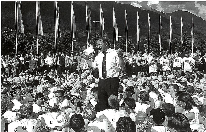
Centinaia di giovani hanno partecipato l'anno scorso alle giornate svizzere dello sport scolastico.

per lo squash, una sala pesi, una sauna a cui si aggiungono una mensa e un caffè.