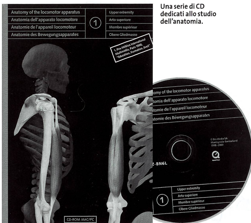
Una serie di CD dedicati allo studio dell'anatomia.

Come leggiamo nel risvolto di copertina, «Quest'opera riguarda l'anatomia dell'apparato locomotore. Divisa in tre CD-Rom: 1 Arto superiore, 2 Arto inferiore, 3 Tronco e testa, si indirizza a studenti di medicina, biologia, fisioterapia, ergoterapia, tecnici in radiologia, educazione fisica, ed operatori del settore sanitario in genere.» Probabilmente, aggiungiamo noi, sarebbe interessante anche per una scuola, che volesse offrire all'allievo la possibilità di saperne di più in merito al funzionamento del proprio corpo, magari appassionandosi ad un settore altrimenti abbastanza ostico qual è l'anatomia umana. m