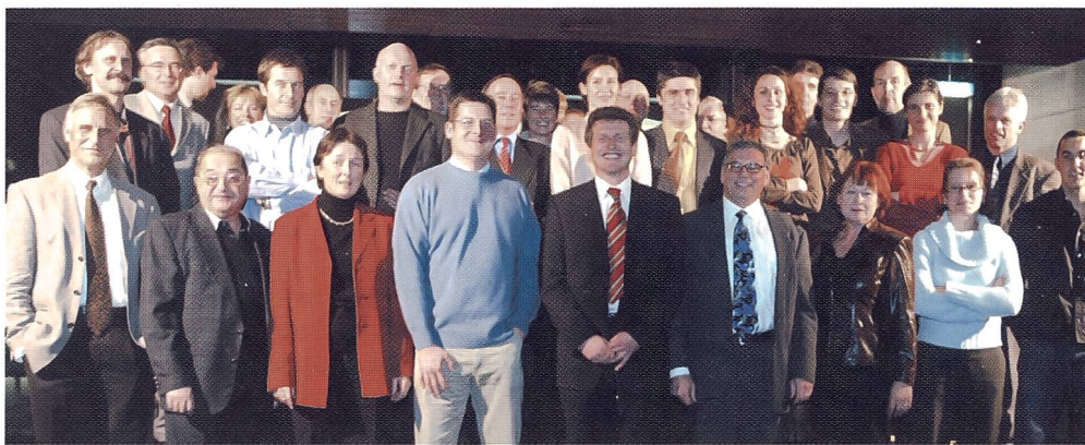
Una foto di gruppo prima di soffiare tutti insieme sulle cinque candeline!

sensi del termine, della rivista: redattori, traduttori, collaboratori, membri del comitato di redazione, editori, sponsor, inserzionisti, ... Non resta che augurare a «mobile» e a tutti noi... cento e più di questi giorni!