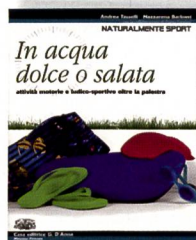
Tasselli A.; Barbieri N.; con la collaborazione di Catalani F.: In acqua dolce o salata. Attività motorie e ludico-sportive oltre la palestra. Casa editrice G. D'Anna, 2006.

Si tratta di un testo molto interessante sia dal punto di vista della struttura sia da quello della ricchezza di contenuti. Si presta molto bene per la preparazione di una settimana bianca, verde o per una semplice gita. Bettina Della Corte Locatelli