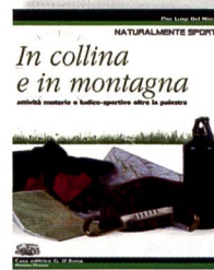
Del Nista, P.: In collina e in montagna. Attività motorie e ludico-sportive oltre la palestra. Casa editrice G. D'Anna, 2006

► La struttura di questo libro è molto particolare ed è adatta all'uso scolastico. I due temi principali in cui è suddiviso, «L'escursionismo» e «Scivolare sulla neve», sono contraddistinti da un colore diverso e sono introdotti con un discorso che elenca sia i prerequisiti che gli obiettivi. I capitoli, i paragrafi e i sottoparagrafi sono completi di illustrazioni molto belle che rendono la lettura piacevole ed interessante. Al termine di ogni sezione l'allievo ha la possibilità di verificare se ne ha compreso il contenuto. Il glossario inoltre contiene le espressioni e i termini tecnici utilizzati nei vari capitoli.