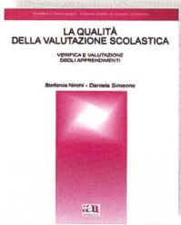
Nirchi, S.; Simeone, D.: La qualità della valutazione scolastica. Verifica e valutazione degli apprendimenti. Anicia, Roma, 2004.