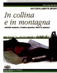
Del Nista, P.: In collina e in montagna. Attività motorie e ludico-sportive oltre la palestra. Casa editrice G. D'Anna, 2006

► La struttura di questo libro è molto particolare ed è adatta all'uso scolastico. I due temi principali in cui è suddiviso, «L'escursionismo» e «Scivolare sulla neve», sono contraddistinti da un colore diverso e sono introdotti con un discorso che elenca sia i prerequisiti che gli obiettivi. I capitoli, i paragrafi e i sottoparagrafi sono completi di illustrazioni molto belle che rendono la lettura piacevole ed interessante. Al termine di ogni sezione l'allievo ha la possibilità di verificare se ne ha compreso il contenuto. Il glossario inoltre contiene le espressioni e i termini tecnici utilizzati nei vari capitoli.