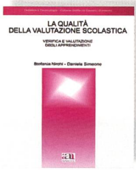
Nirchi, S.; Simeone, D.: La qualità della valutazione scolastica. Verifica e valutazione degli apprendimenti. Anicia, Roma, 2004.