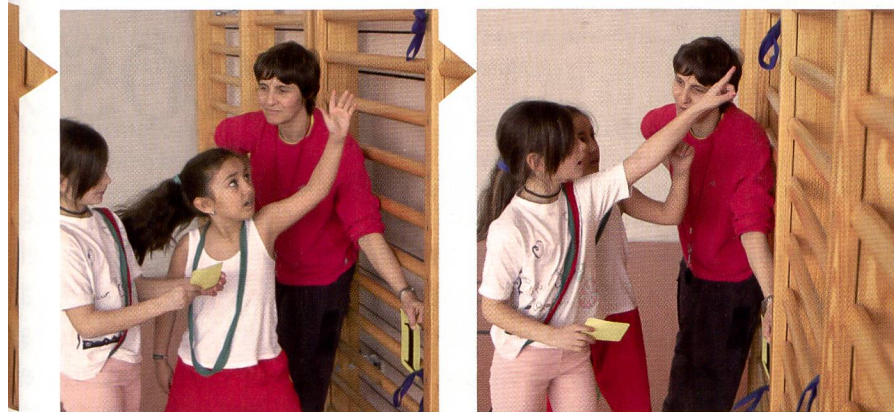
Dimostrare i compiti o spiegarli a parole: due metodi che si completano vicendevolmente e che portano gli allievi a scoprire il piacere di apprendere.

cosiddetti «punti nodali» permette di eseguire il movimento con maggior consapevolezza.