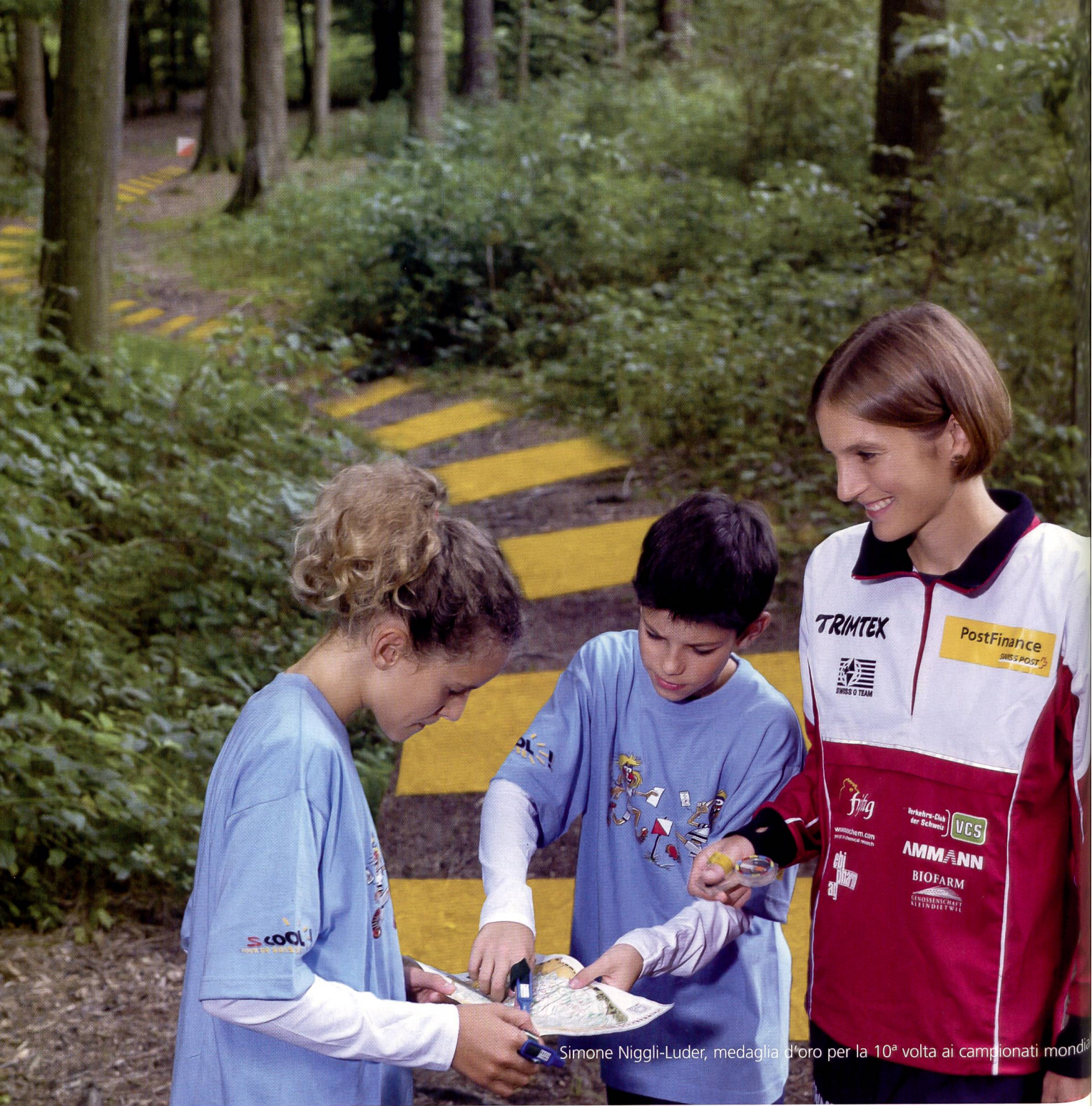
Simone Niggli-Luder, medaglia d'oro per la 10ª volta ai campionati mondiali