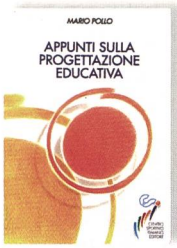
Pollo, M. Appunti sulla progettazione educativa. Roma, Centro Sportivo Italiano Editore, 1996.

► La didattica è il perno attorno al quale ruota la concezione di questo manuale. Il testo elaborato da Mario Pollo, in collaborazione con il Centro Sportivo Italiano, è un valido supporto per l'organizzazione di un corso di didattica per futuri insegnanti, educatori e monitori in ambito sportivo. Dopo un primo capitolo introduttivo sulla natura umana della progettazione, il testo si china sul processo formativo sfruttando ogni capitolo per esporre la normale procedura di una fase d'apprendimento. L'autore parte dalla progettazione educativa come riferimento generale della creazione di una fase d'insegnamento e, in seguito, descrive i processi per una corretta definizione degli obiettivi con il relativo passaggio alla scelta dei compiti. Pollo si sofferma poi sul metodo educativo, attraverso il quale sviluppa il modo corretto per consegnare il compito direttamente nelle mani degli allievi. Questo viaggio didattico si conclude con la presentazione della valutazione formativa atta ad orientare l'allievo sul proprio apprendimento e ad aiutare l'educatore a rielaborare dei nuovi punti di partenza.