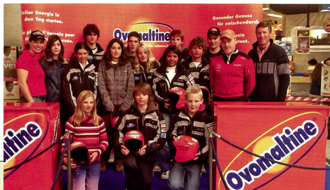
Foto di gruppo per i campioni in erba dello sci vallesano.