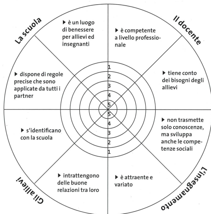
Fig. 3: Un esempio di suddivisione del disco e di denominazione dei diversi settori.

I quattro spicchi potrebbero ad esempio essere denominati nel seguente modo: comportamento del docente, contenuti dell'insegnamento, rapporto con gli allievi, clima di lavoro. A sua volta, ogni settore può essere ulteriormente suddiviso in parti ancora più dettagliate. La sezione scuola, ad esempio, potrebbe essere suddivisa in «benessere dell'allievo» e in «rispetto della deontologia scolastica» (cfr. Fig. 3).