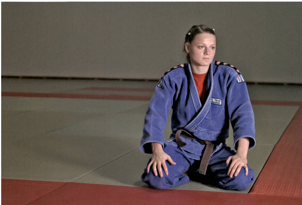
Perché si è deciso di vietare il doping? Per proteggere gli atleti.