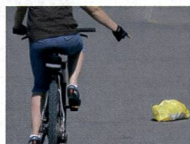
Attenzione, oggetto o buco sulla strada. Scansarlo!