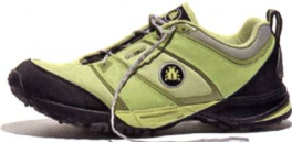
PYTHO BUGrip® Racing