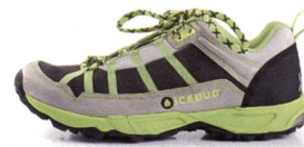
SISU OLX Racing