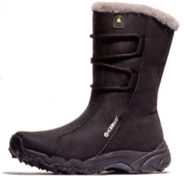
CORTINA BUGrip® Winter