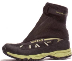
GG FLY BUGrip® Racing