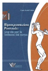
Guidi Fabbri, C.: Riprogrammazione posturale. Una via per la bellezza del corpo. Torgiano: Calzetti&Mariucci, 2010.

Il volume illustra, in maniera semplice e divulgativa, le linee fondamentali delle scuole posturali più accreditate. La riprogrammazione posturale tende a realizzare la bellezza delle forme, l'armonia del corpo e l'elasticità dei muscoli, divenendo un'attività compensativa fondamentale per tutte le discipline sportive. Si tratta di un lavoro sul corpo a partire dai vizi posturali individuali, per poi iniziare una metodologia specifica e personalizzata, che va ad incidere sulle rigidità muscolari e sulla psiche. In ambito fisioterapico la scuola francese (F. Mézières e suoi allievi) ha trovato grandi riconoscimenti ed aperto nuove strade per agire sulla postura con l'obiettivo di arrivare al benessere psico-fisico ed alla bellezza.