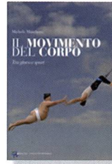
Marchetti, M.: Il movimento del corpo. Tra gioco e sport. Roma: La Meridiana Edizioni, 2010.

Si inizia così: con gioco e movimento. Si prosegue con lo sport. Ad attraversare il tutto, la vita nella sua principale rappresentazione, evidente ed indubitabile: il corpo, anche perché, ormai, il dualismo corpo/mente non regge più. La persona è unità di corpo-anima-spirito. Ma la persona si può scrutare con diverse lenti. Queste pagine una scelta la fanno. Scelgono d'indossare le lenti dell'antropologia cristiana (ammettendo, però, i limiti conoscitivi e di intelligenza) e provano a guardare. Propongono un'osservazione, anzi avanzano una descrizione. Sperando di educare attraverso lo sport. Questo, però, va padroneggiato, immaginato, progettato, amato e conosciuto, per non cadere negli stereotipi.