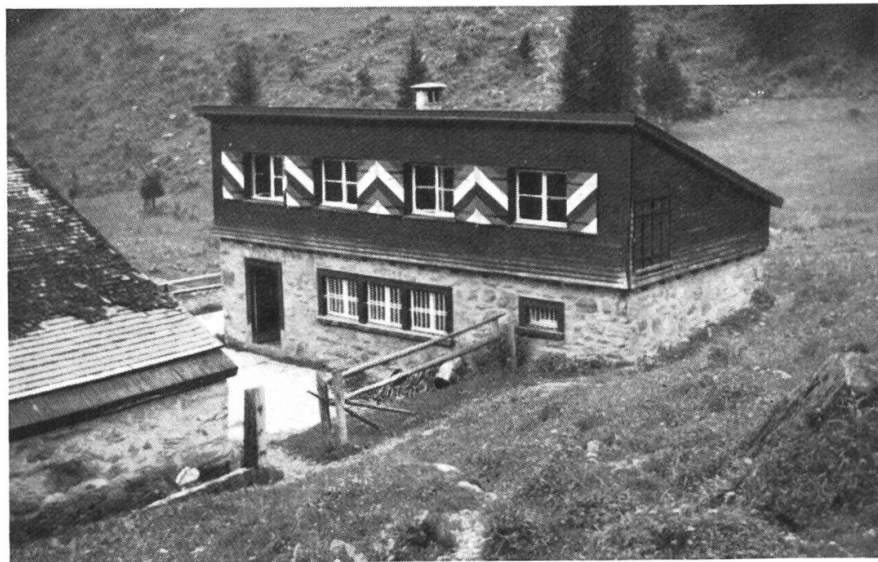
Moderne Sennhütte im Langstafel der Alp Vorder-Durnachtal, 1331 m, 1936 erbaut