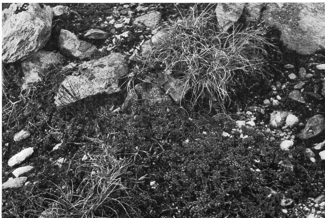
Windharte Spalierrasen der Zwergazalee ( Loiseleuria procumbens ) mit Horsten der Krummsegge. 2300 m