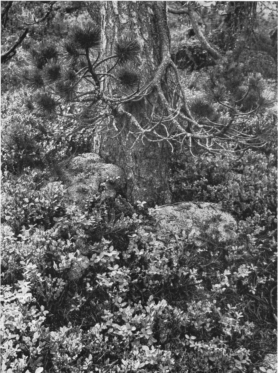
Bergföhrenbestand Mettmen. Heidelbeergesträuch und Torfmooswülste am Stammgrund einer Bergföhre