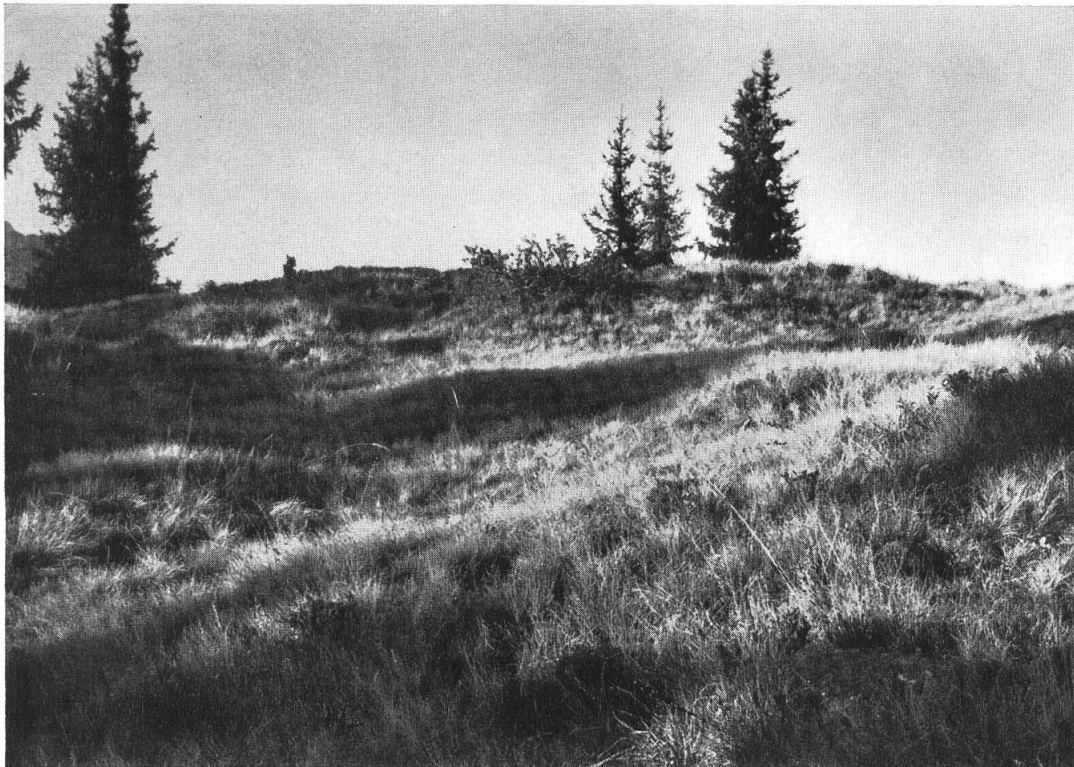
Subalpine Burstweide, mit zerstreuten Gruppen von Heidelbeeren und Alpenrosen. Diestal, 1770 m