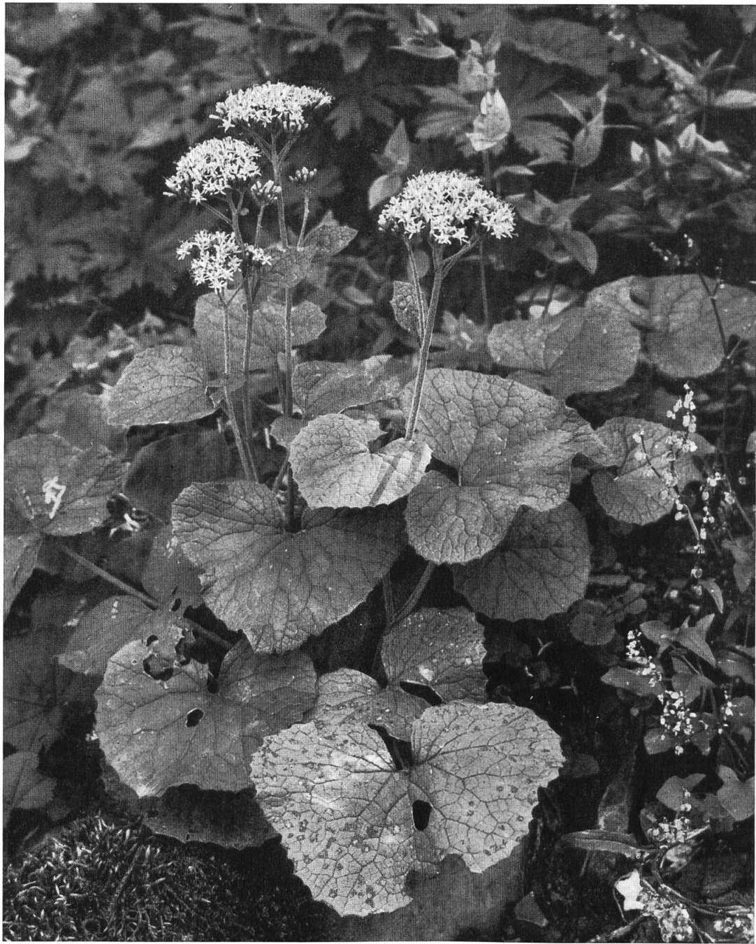
Kahlblättriger Alpendost im Schatten von Grünerlen. Durnachtal, 1700 m