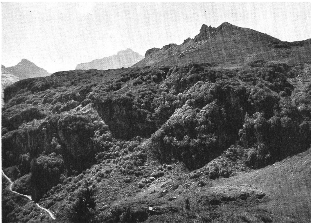
Felsige Grünerlenbestände (Tros) und beweidete Heidelbeeren-Alpenrosenhänge auf der Niederentalp