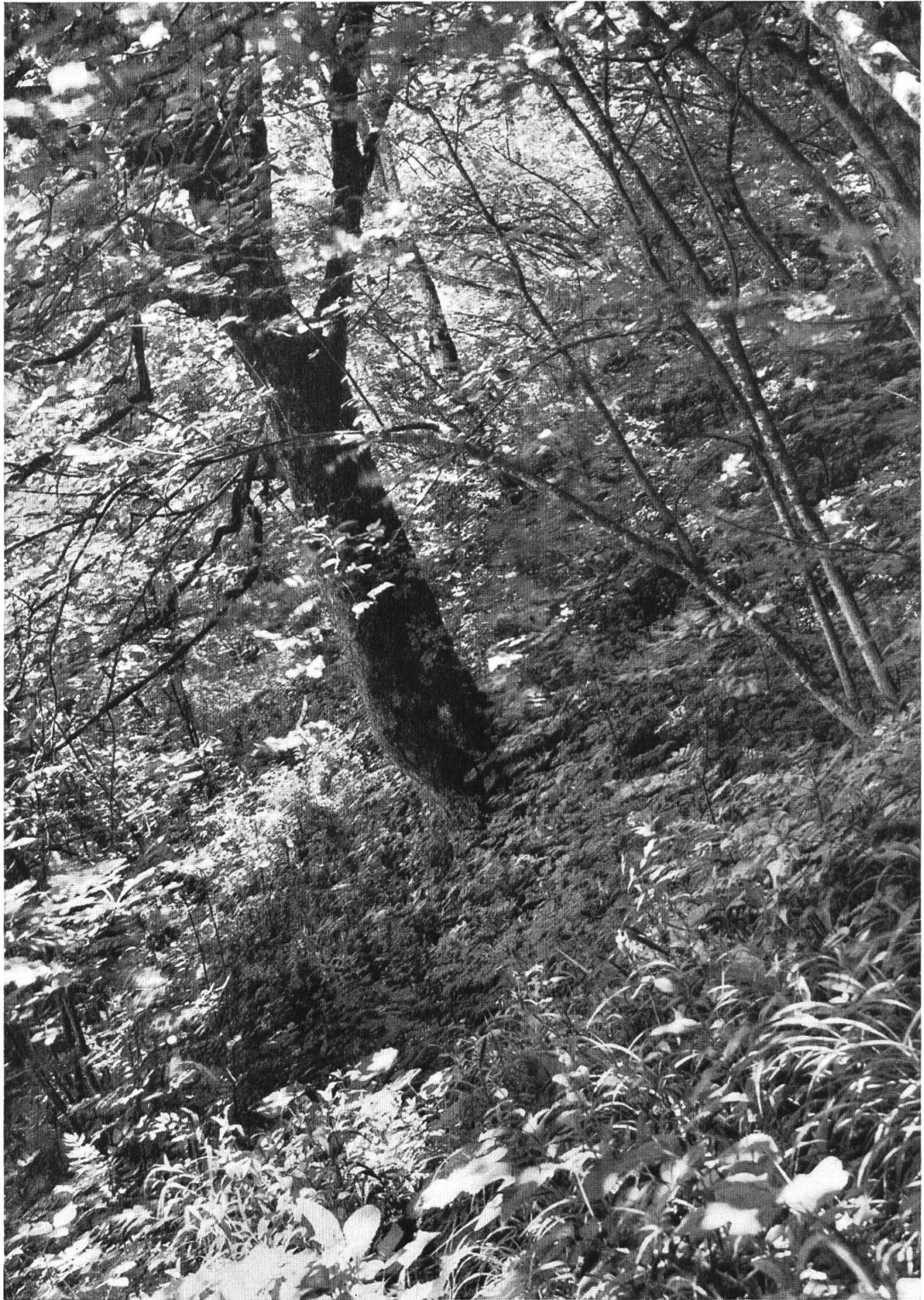
Ausschnitt aus dem Gandwald ob Elm. Im lichten Schatten der Bergahorne entfaltet sich eine reiche Gestrüch- und Kräuterschicht