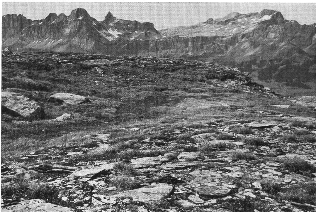
Hochalpine Rasenvegetation am Kärpf, mit Krummsegge und Krautweide. Hintergrund Ortstockgebiet