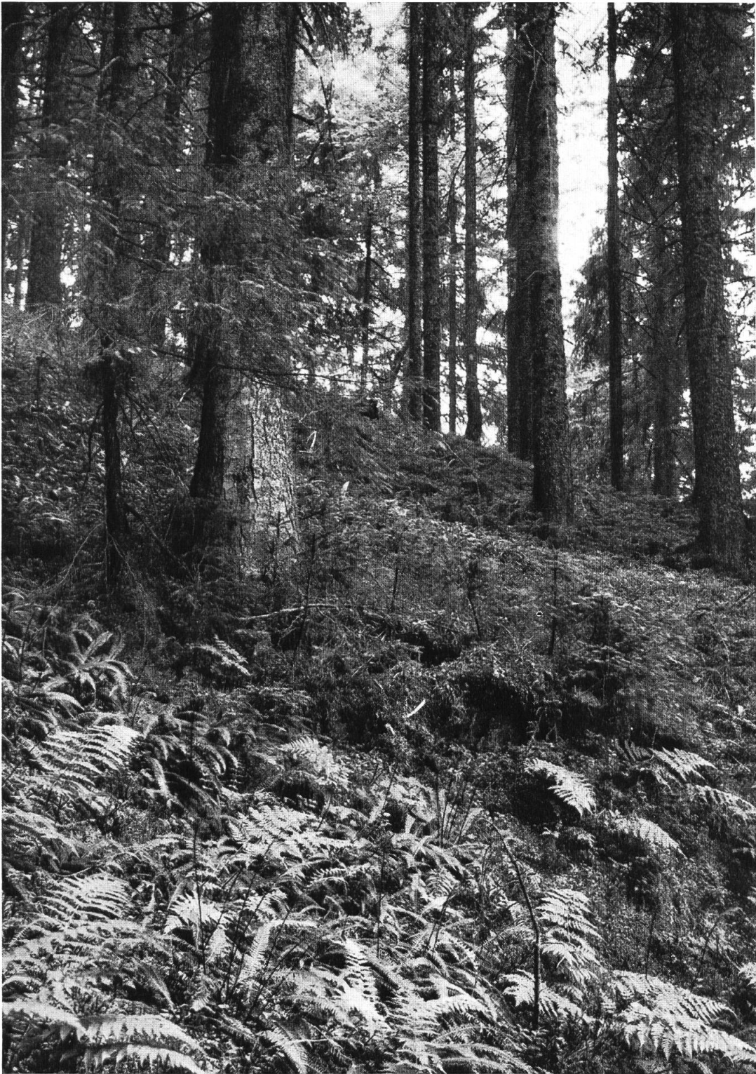
Montaner Fichtenwald mit einzelnen Weißtannen und Buchen (Hintergrund); Fazies mit Heidelbeeren und Farnen. Salen, 1150 m