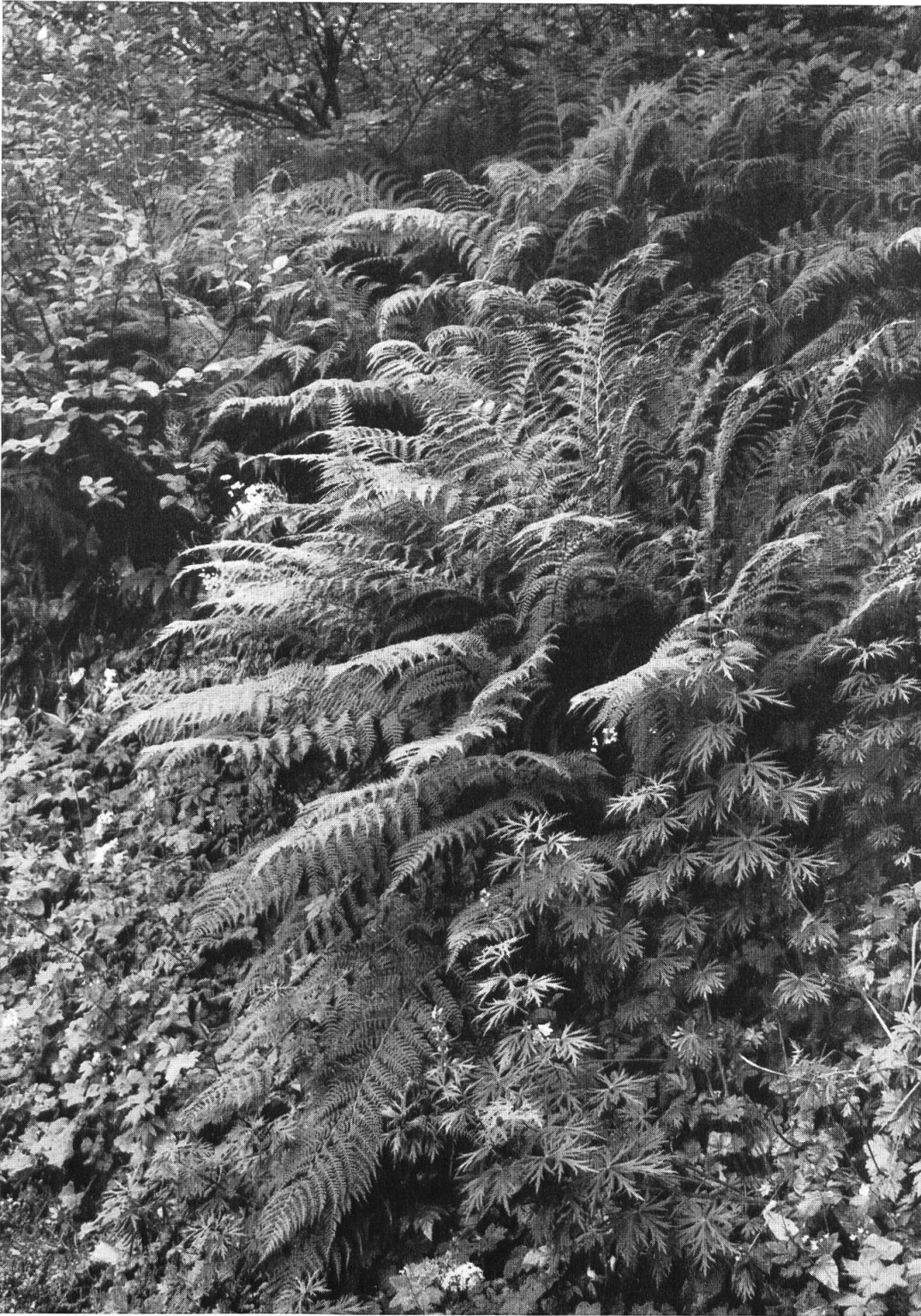
Alpen-Waldfarn zwischen Grünerlen am Nordhang des Matzenstockes, 1650 m