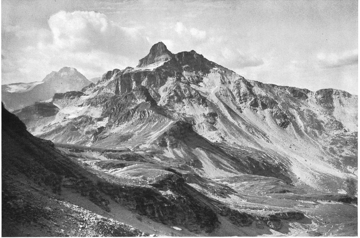
Kärpfstock mit Schwarzschild