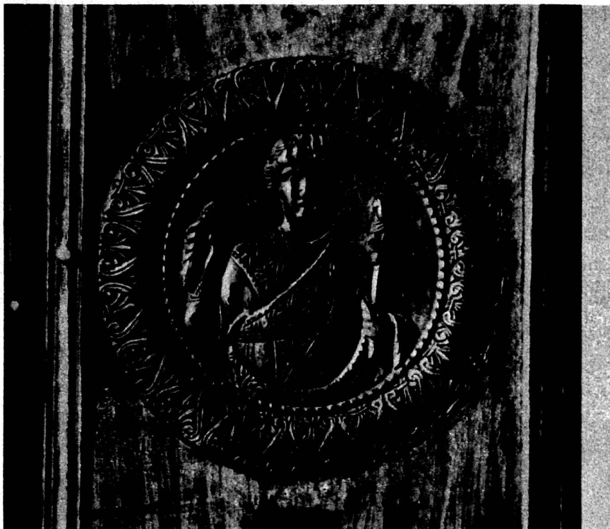
Abb. 3, 4. Medaillons vom Diptychon des Konsuls Apion. Oviedo, Spanien