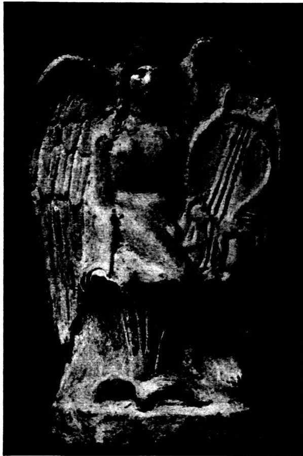
Abb. 5. Terrakotte, Berlin.

Und Eros selbst – des Warnrufs des Alkman nicht achtend – hat sich auf den Ranken, die sich dünn und fein zu den Seiten der Henkelpalmetten zu Spiralen drehen, niedergelassen, um dem wunderbaren Geschehen auf dem Erichthonios-