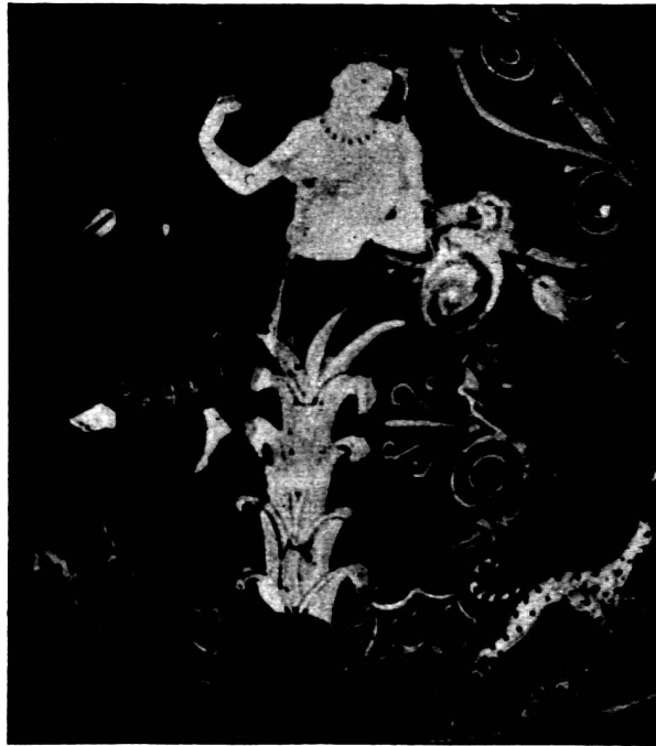
Abb. 7. Apulische Hydria, Neapel.

Doch, was dem Racker Eros, dem vogelleichten, ansteht, schickt sich nicht für jeden. Wenn Io, den Schleier lüftend, sich zur Rast auf einer Staude im Dickicht