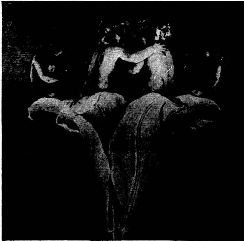
Abb. 6. Ph. O. Runge, Vorarbeit zum «Morgen».

Jedenfalls fühlt er sich sicher im Dickicht des Ornamentes, das ihn trägt – man sieht es, wenn man es auch nicht glaubt. Und was hier Hermonax, der Maler des Gefäßes, in klassischer Gestalt zeigt, lebt weiter und wuchert weiter. Immer