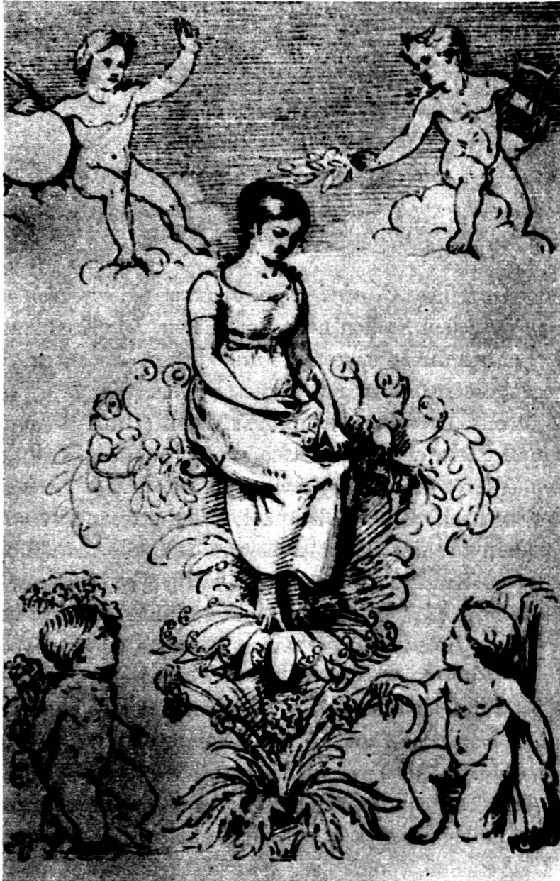
Abb. 8. Ph. O. Runge, «Natur».

Nur dem, der wie Eros unbeschwert und vogelleicht ist, bieten Blüten und zarte Ranken sicheren Halt. Er schwebt im Sonnenschein über die von Blumen duftende Wiese und treibt im Schatten lauschiger Adonisgärtchen sein Wesen.