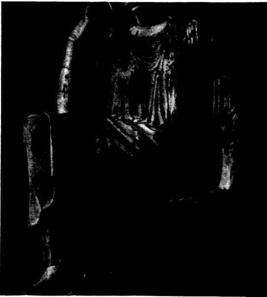
Abb. 3. Vatican.