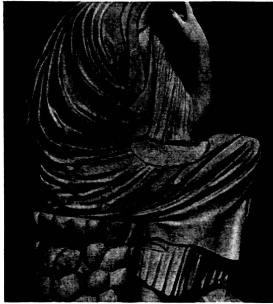
Abb. 4. Vatican.

heraustretende Faltengrate, die sich bisweilen gabeln. An dem neu gefundenen Torso ist es, als hätten sich diese greifbaren und kräftig abhebenden Faltenrippen in ein zartes Spiel sich stauender und verfließender Faltenschwellungen aufgelöst. Deshalb wohl mutet am Torso die Stofflichkeit des ganzen Mantels weicher, gleichsam luftgefüllt an. Er bildet am Rücken und Nacken nur noch tastbare, keine greifbaren Erhebungen 3 . Die Hand, die ihn geformt hat, scheint subtiler und reifer gewesen zu sein als die nuancenärmere, weniger illusionistische an den römischen Kopien. Hier sind es kräftig klare Faltenakkorde in der Art des herben Stils (Abb. 6), dort aber ein in sich verspanntes zartes Wellenspiel von Falten in der dem frühen 4. Jahrhundert geläufigen Modellierung (Abb. 5) 4 .