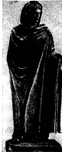
Abb. 6. «Aspasia».

So scheint auch hier die herbere und altertümlichere Formenüberlieferung von den römischen Kopien gegeben zu werden, während die flüssigere und zartere des Torsos mit jüngeren Nuancen durchsetzt ist, die bei aller Schönheit der Gesamterscheinung dem Werk etwas Zwiespältiges geben.