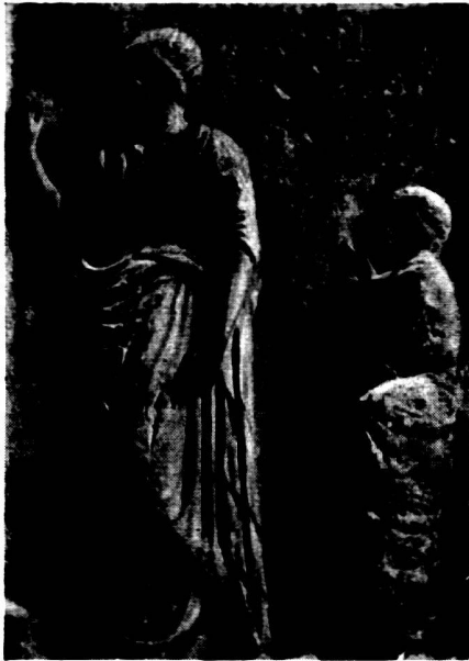
Abb. 5. Relief Louvre.

In der Modellierung der vorderen Mantelseite weicht der Torso nicht so greifbar ab. Dennoch wird man feststellen müssen, daß seine Faltenbahnen auch hier eine größere Schmiegsamkeit des Stoffes zum Ausdruck bringen. Die mangelhafte anatomische Wiedergabe über der Kreuzungsstelle der übereinandergeschlagenen Beine wird dadurch sichtbarer als an den römischen Kopien. Diese kritische Stelle wird durch den herben Faltenfluß an den römischen Kopien weit besser cachiert.