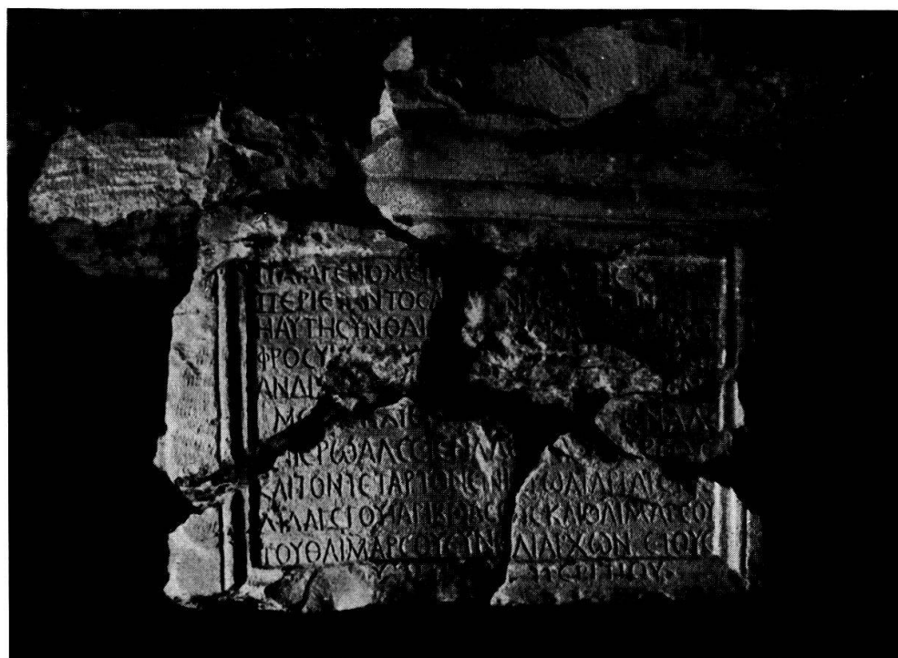
Fig. 2. Face latérale gauche.