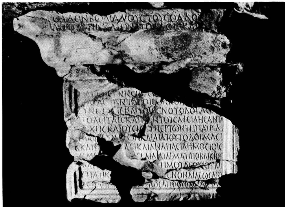
Fig. 1. Face antérieure.

lorsque les quatre tribus ne sont pas mentionnées expressément, c'est-à-dire lorsque l'offrande est faite par d'autres dédicants, caravane ou Etat – cette habitude doit être mise en rapport, semble-t-il, avec l'existence de ces quatre tribus qu'on