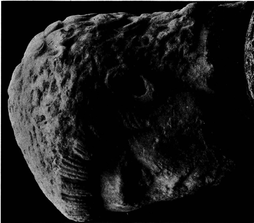
Tafel 3. Constantius II. als Caesar (?), Istanbul.