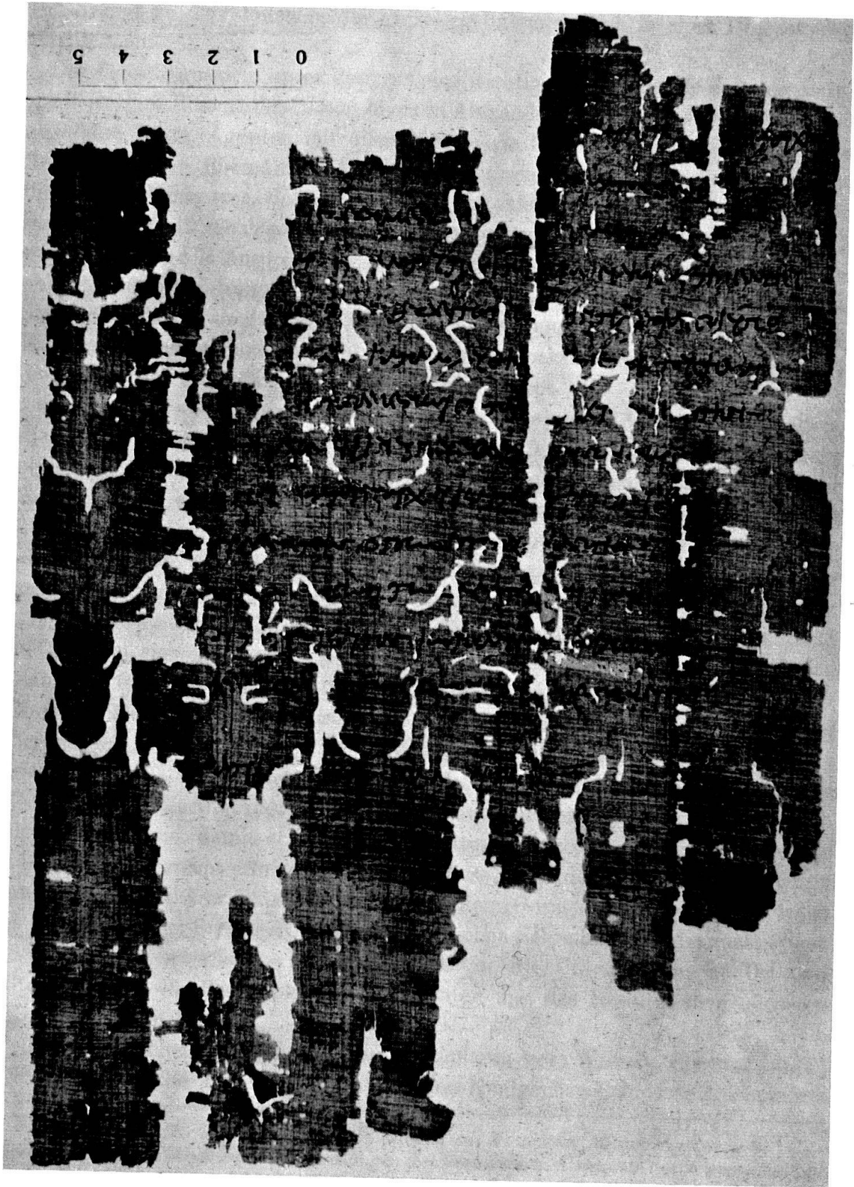
Papyrus Vindobonensis D 6.889.