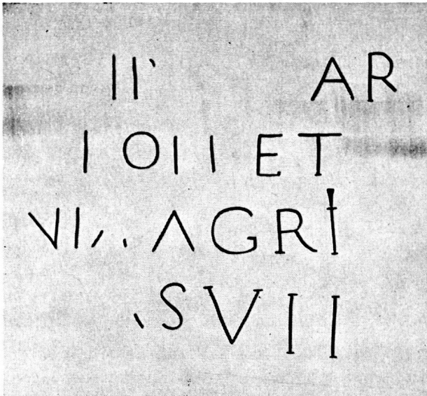
Der Leugenstein von Sechtem bei Bonn