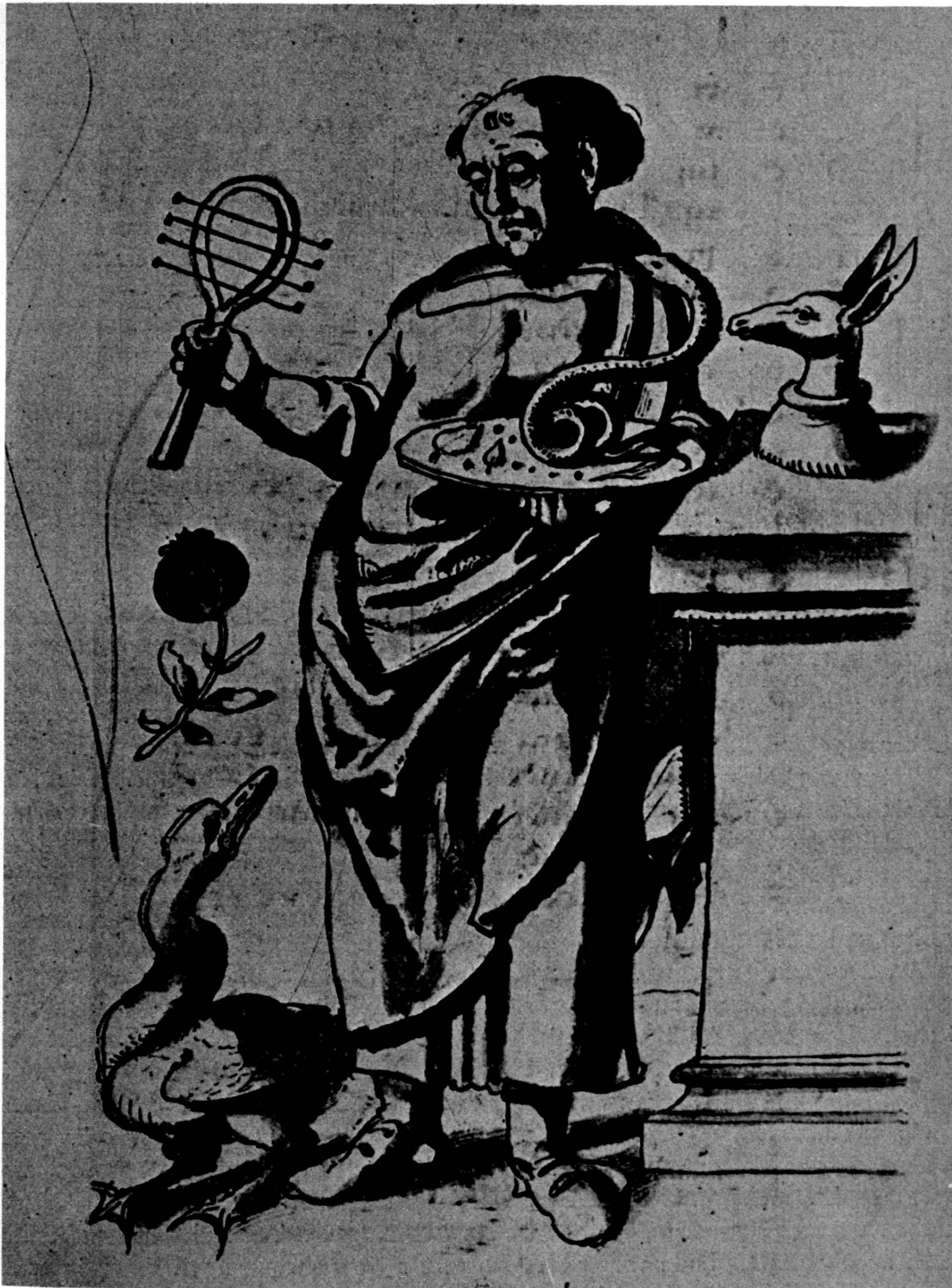
Fig. 1. Copie de Cranach l'Ancien (Vienne).