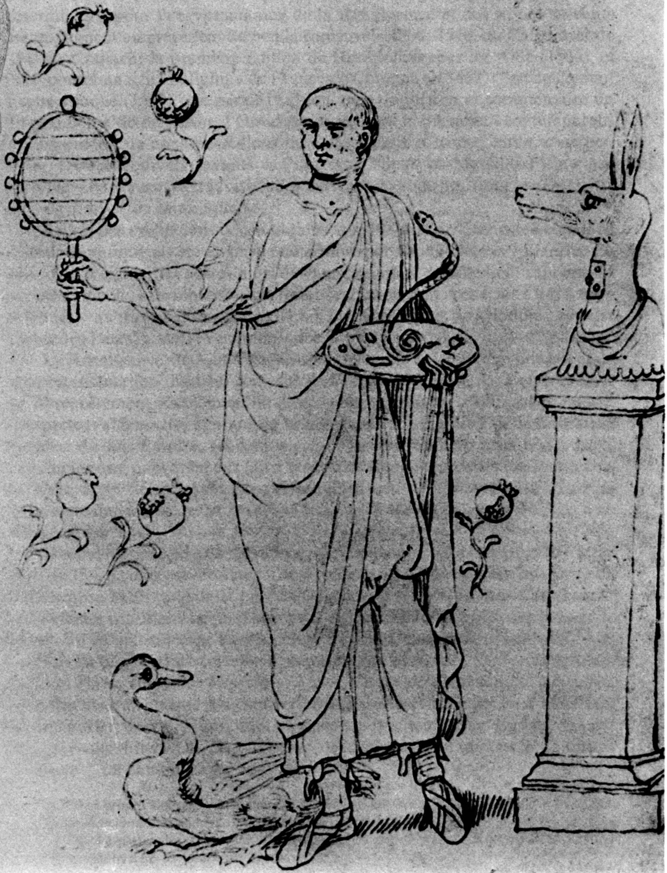
Fig. 3. Copie de Bruxelles.