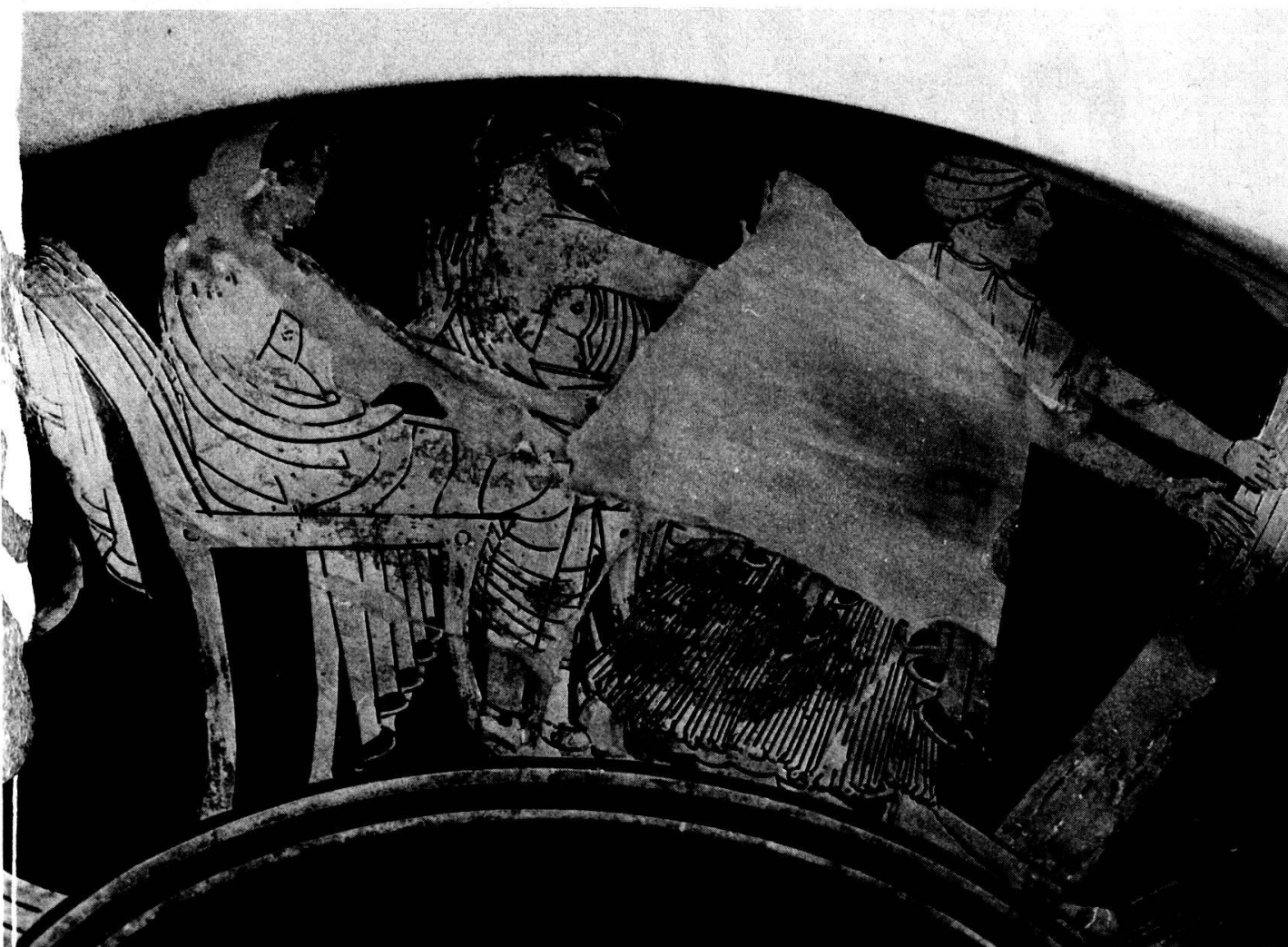
Planche 1. Francfort/Main. Liebieghaus. Coupe du peintre de Castelgiorgio.