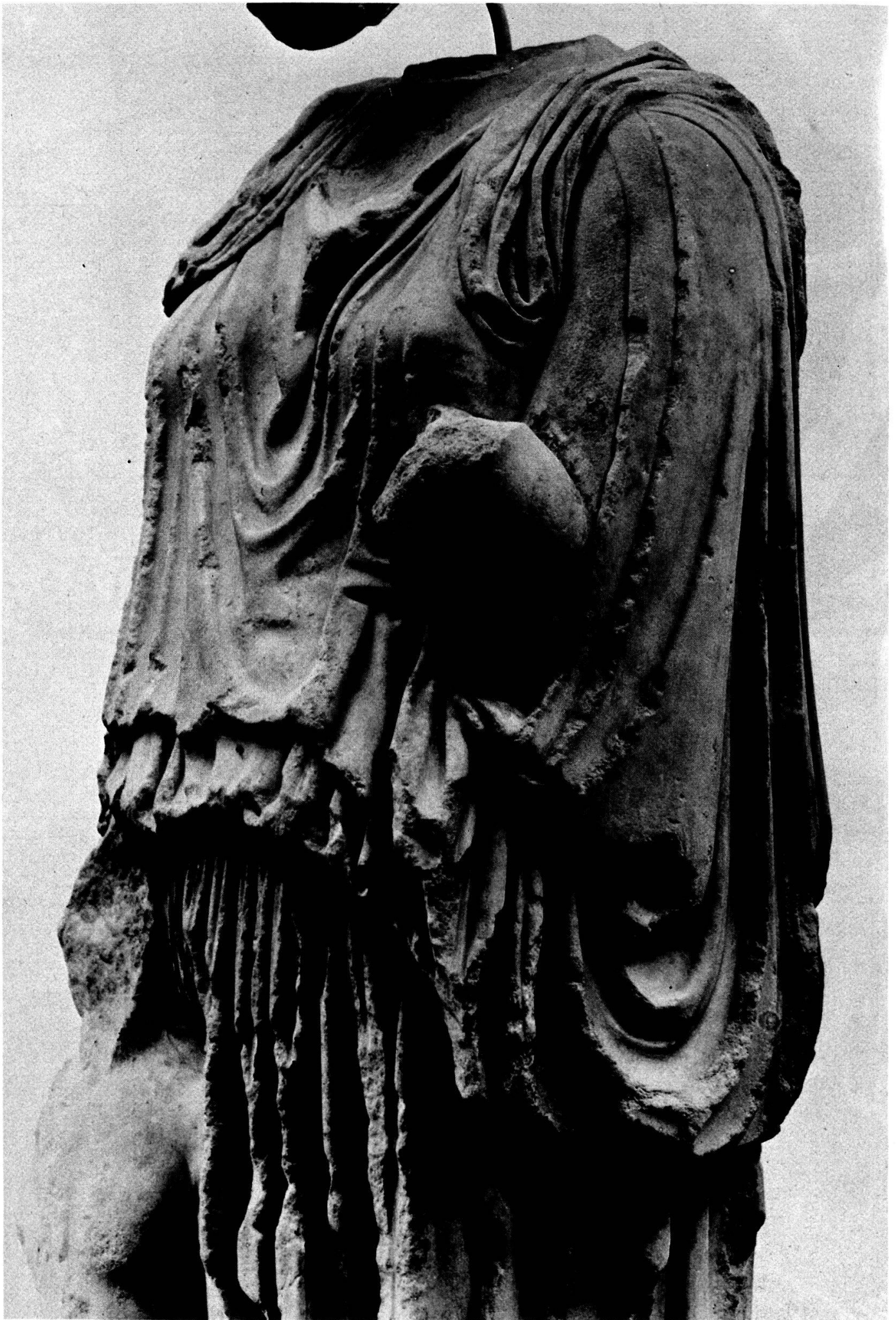
Planche 6. Athènes. Musée de l'Acropole. Détail de la Procné d'Alcamène.