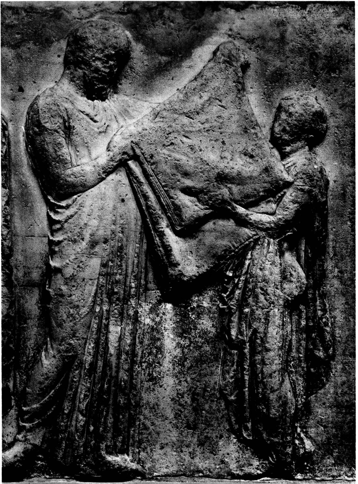
Planche 4. Londres. British Museum. Frise est du Parthénon V 34. 35.