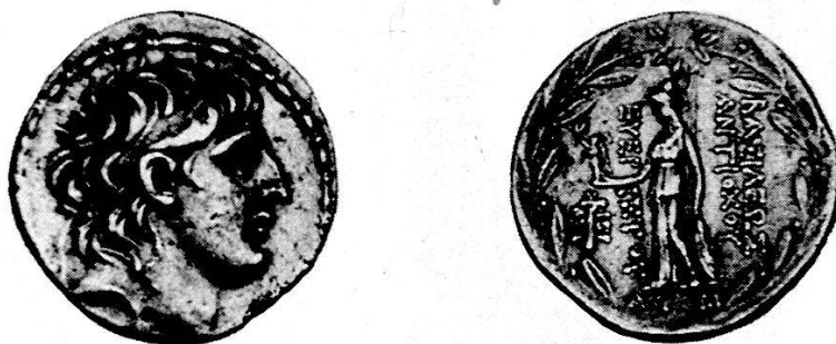
Tav. 2, 3. Antioco VII Sidetes, tetradramma di argento (Numism. Fine Arts, Auct. XVIII, 1987, no. 370)