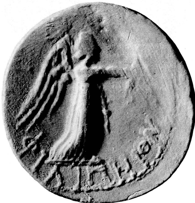
Tav. 1. ΦΙΛΙΠΠΙΟΝ di oro, rinvenuto in un podere nell'area di Morgantina (impronta in gesso, ingrandita; v. Tav. 2, 1)