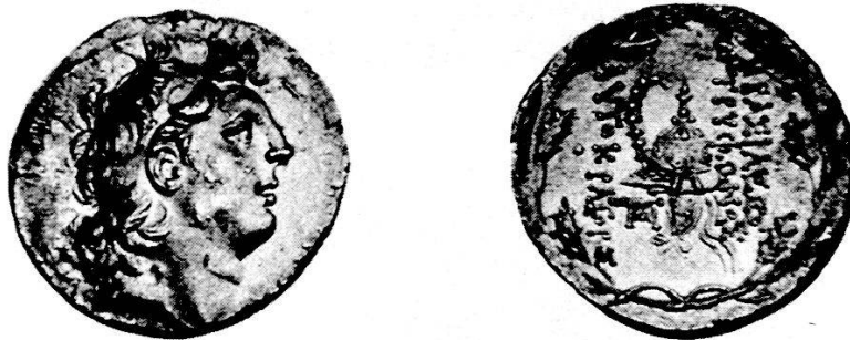
Tav. 2, 2. Tryphon di Siria, tetradramma di argento (Numism. Fine Arts, Auct. XVIII, 1987, no. 368)